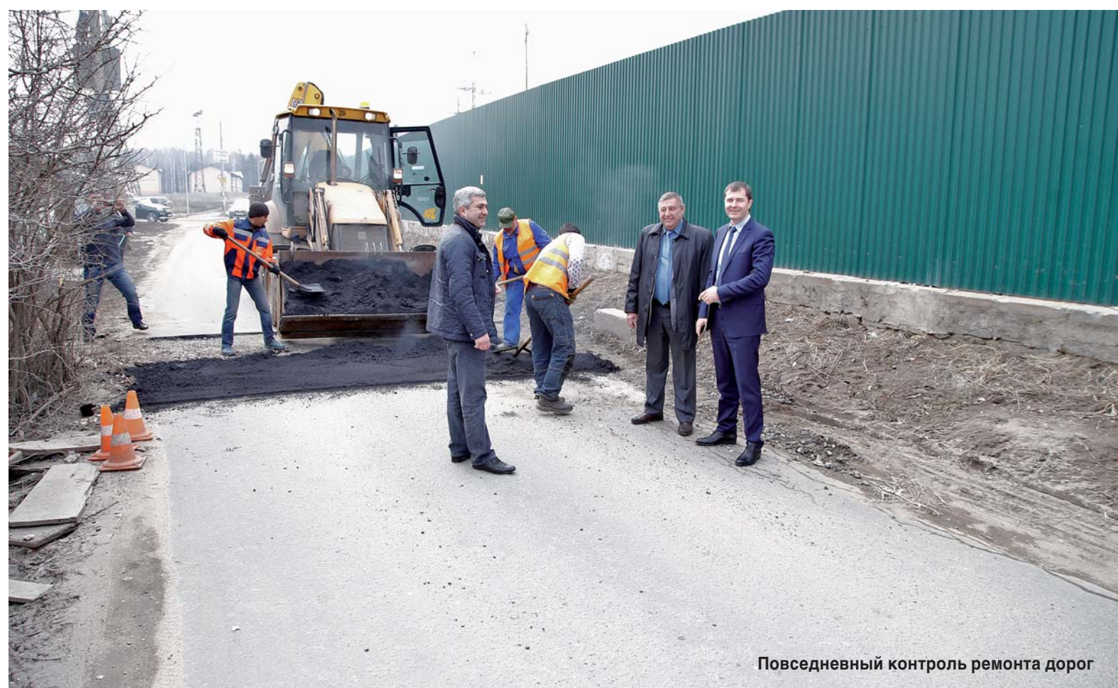
Повседневный контроль ремонта дорог

- В настоящее время у нас в наличии 10683 парковочных места. Учитываются жилой фонд, авто ГСК, СНТ, перехватывающие парковки. По нормативу на 1000 человек должно быть 420 парковочных мест. Для населения Краско-