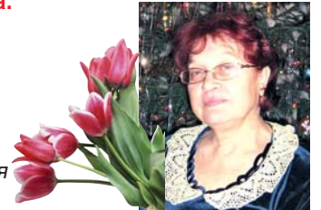
С любовью от твоей большой семьи

70 – юбилей твой почтенный. Будь же здоровою ты, не болей. Радуйся искренне и вдохновенно Шалостям внуков и счастьем детей! Ты заслужила к себе уваженье. Низкий поклон тебе, честь и хвала. Пусть не один еще твой день рожденья Нас соберет всей семьей у стола!