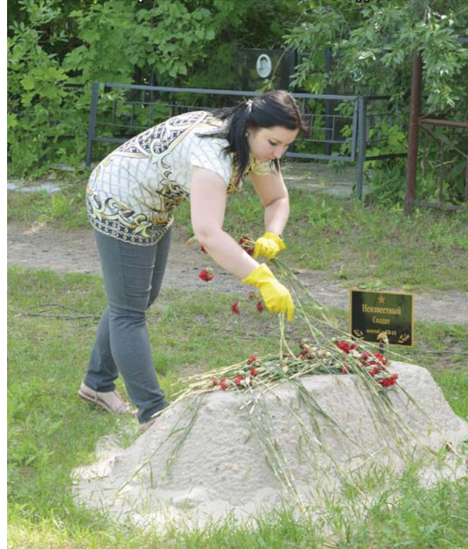
На месте захоронения Неизвестного Солдата

Уважаемые жители Томилино, трудовые коллективы, работники подразделений администрации, депутаты, представители общественных организаций!