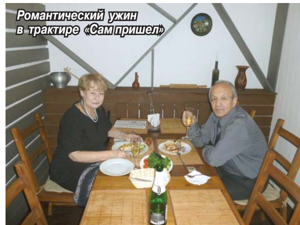
Романтический ужин в трактире «СамПришел»

Хочу выразить огромную благодарность организаторам ежегодного фотоконкурса «Мы живем в Томилино».