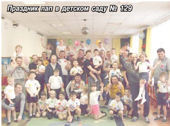
Праздник пап в детском саду № 129