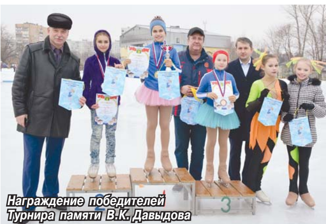
Награждение победителей Турнира памяти В.К. Давыдова