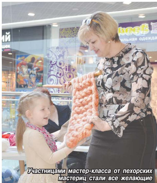
Участницами мастер-класса от пехорских мастериц стали все желающие