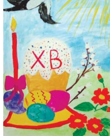
Рисунок Александры Беляевой

– В предстоящее воскресенье, 1 мая, православный мир будет отмечать главный христианский праздник – Пасху. Наверняка к этому радостному событию активно готовится и воскресная школа «Надежда»? С каким напутствием вы хотели бы обратиться в этот день к вашим ученикам?