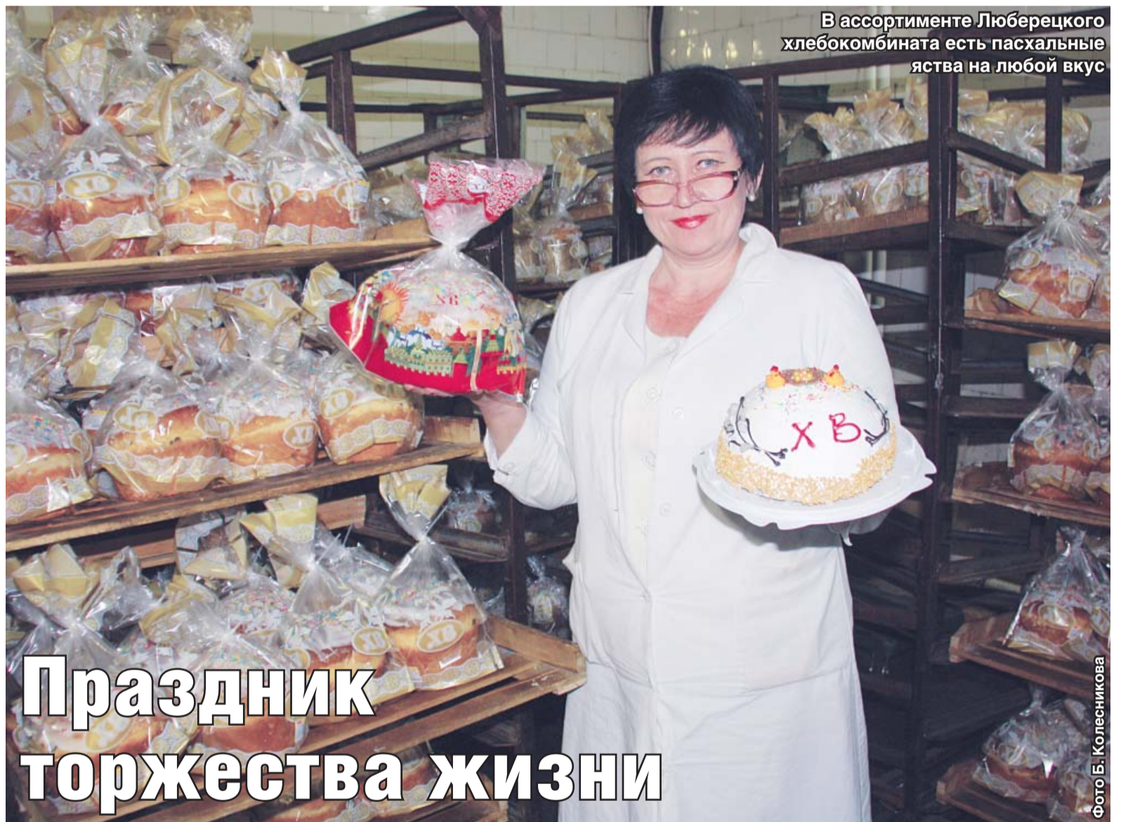
В ассортименте Люберецкого хлебокомбината есть пасхальные яства на любой вкус