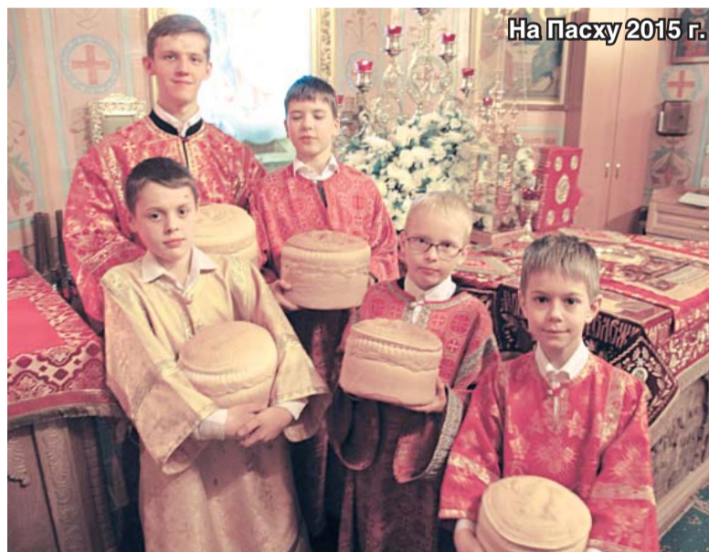
На Пасху 2015 г.

– Среди читателей нашей газеты немало тех, чьи дети или внуки посещают школу «Надежда». По их отзывам, главным, почему они привели туда своих чад, была надежда на их