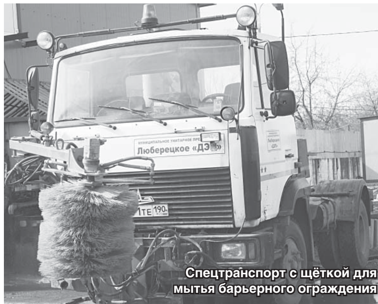
Спецтранспорт с щёткой для мытья барьерного ограждения

– Несколько месяцев назад «Люберецкая газета» публиковала большой репортаж, посвящённый проблеме, когда сне-