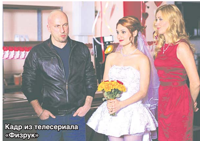
Кадр из телесериала «Физрук»

– Ты выросла за кулисами Театра сатиры. Знаю, что