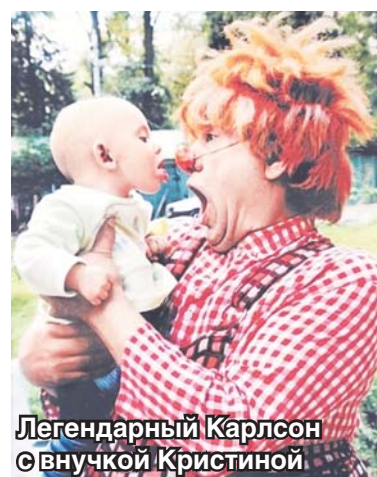
Легендарный Карлсон