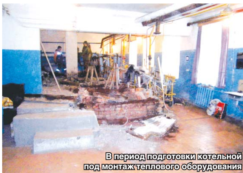
В период подготовки котельной под монтаж теплового оборудования

с такой нагрузкой не справиться. Поэтому уже сегодня, за полгода до нового отопительного сезона, мы приступили к перевооружению тепловых сетей и теплоэнергетического оборудования».