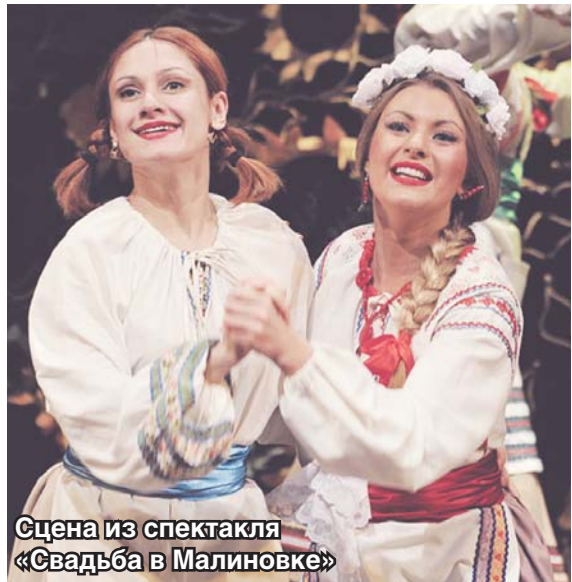
Сцена из спектакля «Свадьба в Малиновке»

Богдан КОЛЕСНИКОВ фото автора и из архива Карины Мишулиной