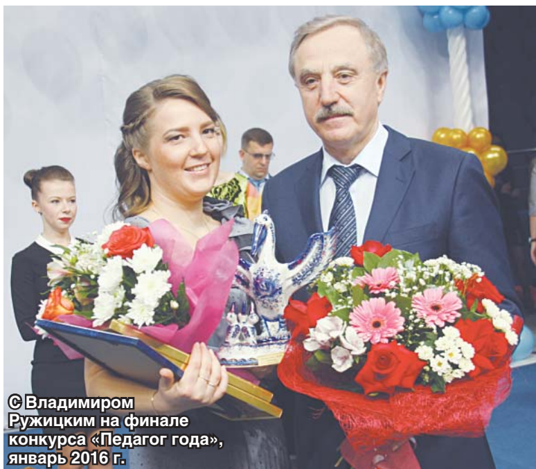
© Владимиром Ружицким на финале конкурса «Педагог года», январь 2016 г.