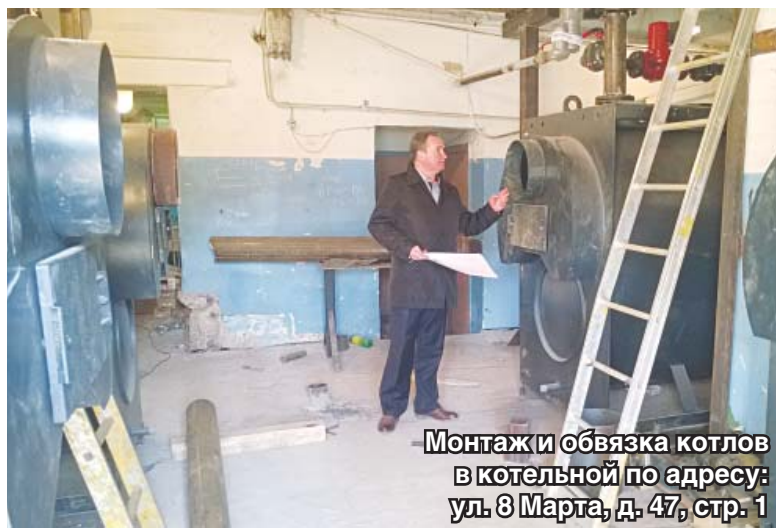
Монтаж и обвязка котлов в котельной по адресу: ул. 8 Марта, д. 47, стр. 1