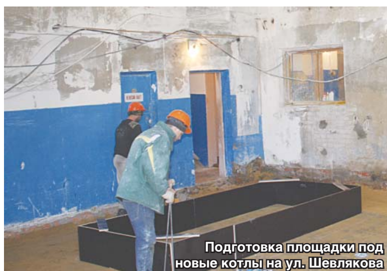
Подготовка площадки под новые котлы на ул. Шевлякова

Как отметил главный инженер АО «Люберецкая теплосеть», такая масштабная реконструкция –