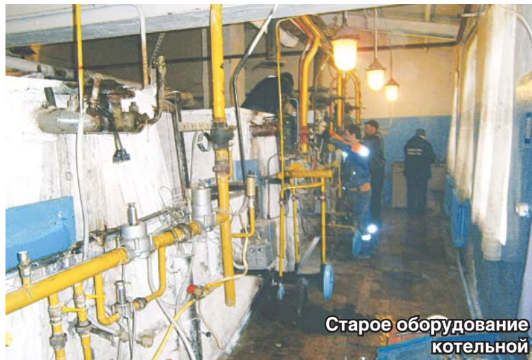
Старое оборудование котельной

Надо сказать, что даже после запуска котельной, пуско-наладочные работы продолжают. По нормативам, они могут идти около 3-х месяцев. Только после завершения таких работ инспекторы Ростехнадзора дают разрешение на пуск объекта в эксплуатацию. Но у нас есть намерение, чтобы с начала отопительного сезона эта котельная уже работала. Если возникнут сложности, то жители будут снабжаться теплом по нынешней схеме, с соседней котельной на Шевлякова.