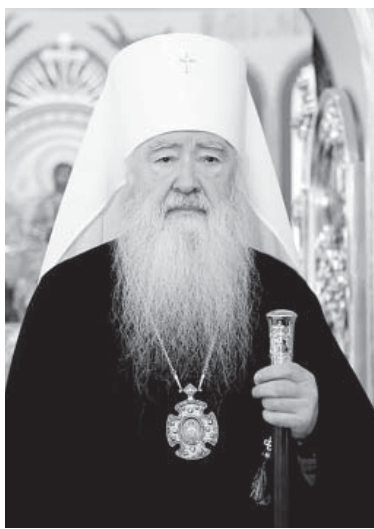
«Сироту приютить – что Храм построить!»