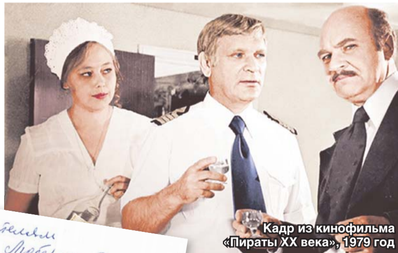
Кадр из кинофильма «Пираты XX века», 1979 год

Читательница Люберецкой газет! Много благодарна вашим сельским любви! Здоровья! Пусть в нашей стране будет мир! НХЗ