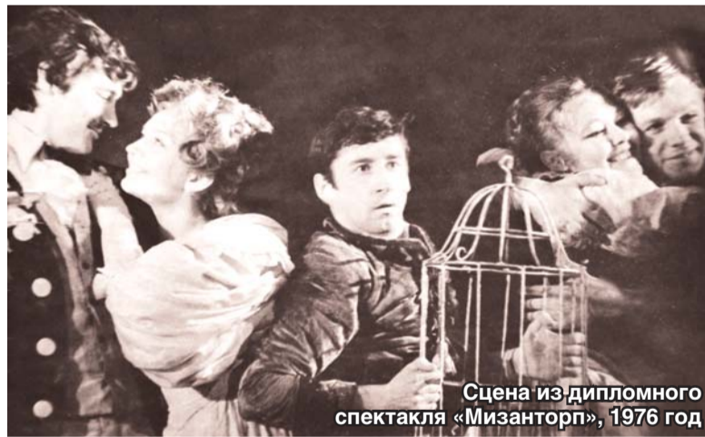
Сцена из дипломного спектакля «Мизантроп», 1976 год