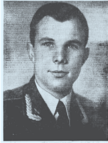
ПРЫЖОК ВО ВСЕЛЕННУЮ

мастерство владения сценической речью. Номинаций, за победу в которых предстоит «сразиться» поклонникам поэзии и космонавтики, всего две: в одной из них жюри будет оценивать выступление каждого участника с