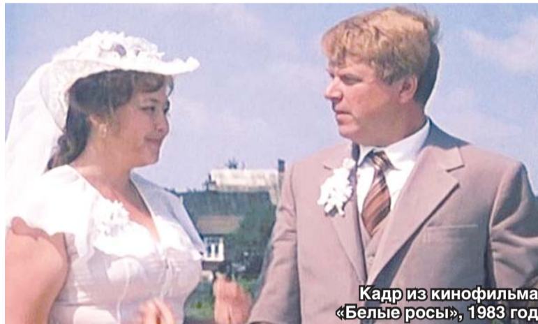
Кадр из кинофильма «Белые росы», 1983 год