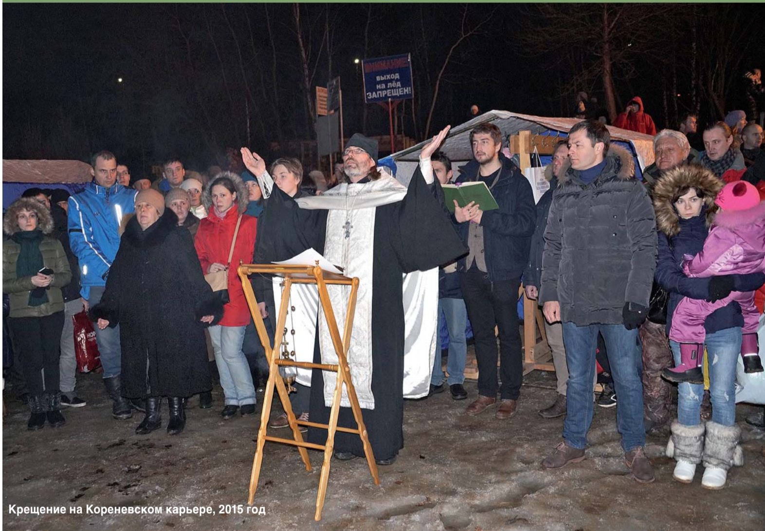
Крещение на Кореневском карьере, 2015 год