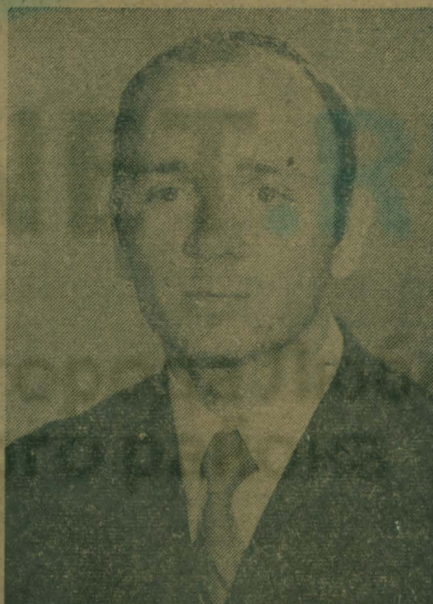
Командир космического корабля «Союз-13» Петр Ильич Климук. Бортинженер космического корабля «Союз-13» Валентин Витальевич Лебедев.