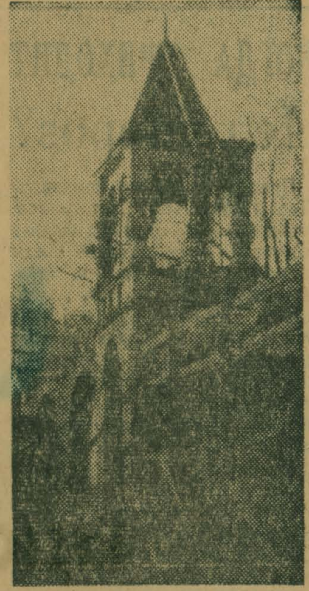
ские постройки с фигурными воротами, мостами и т. д., многие архитектурные детали применили при постройке этой стены. Так что на самом деле она и не византийская, и не иерусалимская. В. МИТЮШКИН.

архиерейский дом с огромным садом, обнесенным стенами. Одну из стен называют и византийской, и иерусалимской. Дело в том, что в Острове была усадьба наподобие царичинской. Разобрав псевдо-готиче-