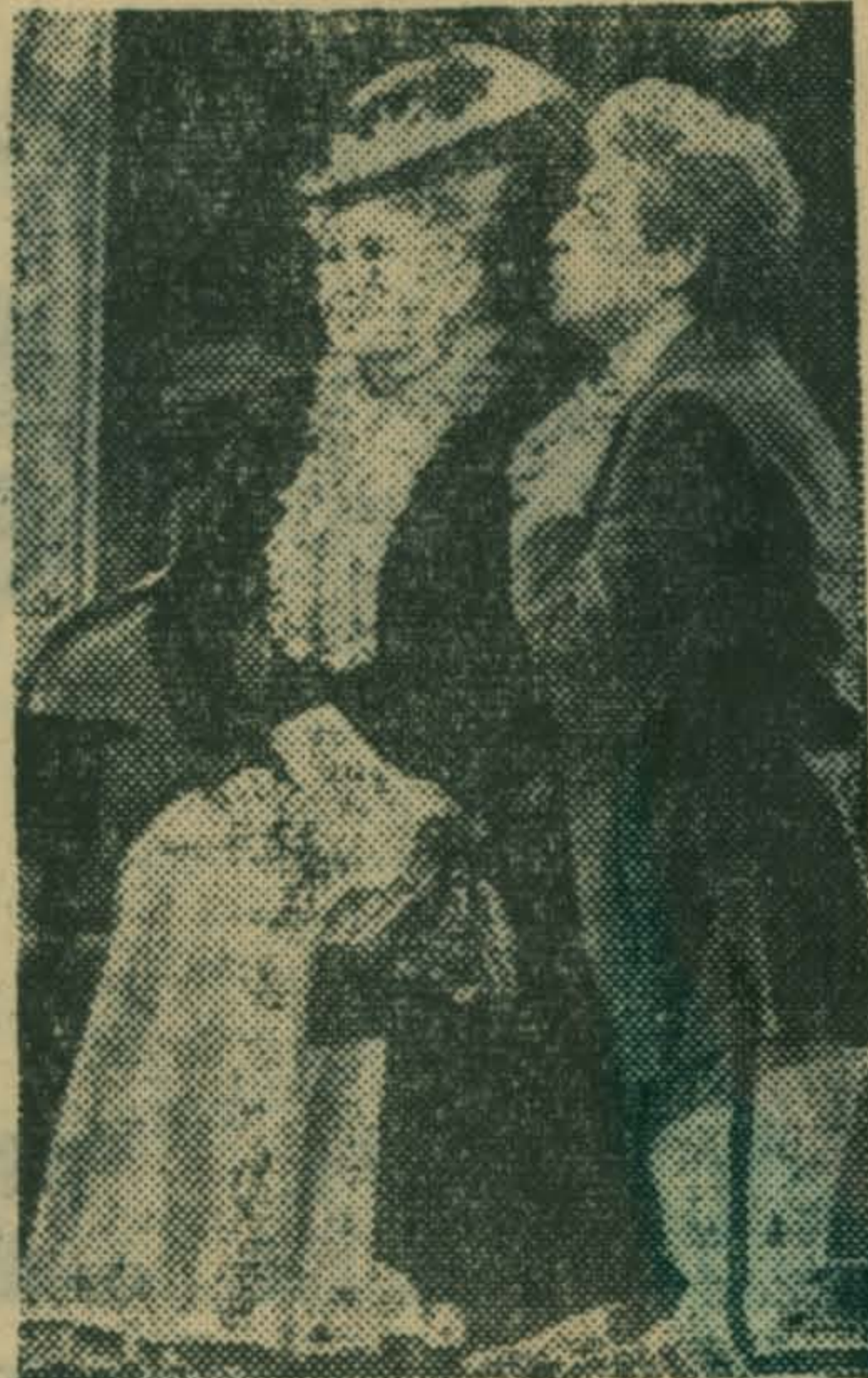
МОСКВА. На сцене Московского Художественного академического театра Союза ССР имени М. Горького поставлен спектакль по пьесе А. Н. Островского «На всякого мудреца довольно простоты».