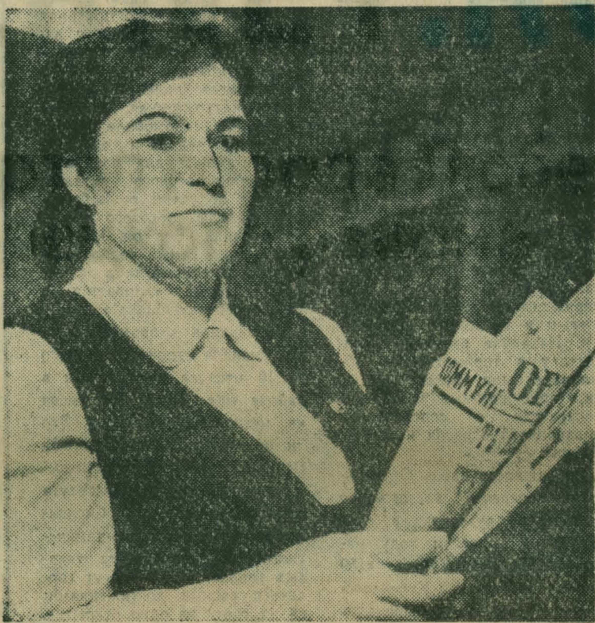
Хорошо идет подписка на газеты и журналы на Томилинском заводе полупроводниковых приборов.

Но ведь эти сроки уже уходят, от раскочки здесь следует срочно перейти к делу. Ф. ФЕДОРОВ.