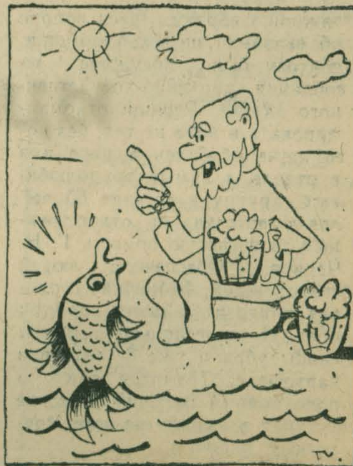
— Старухе все равно не угодишь, а мне бы одну воблочку.