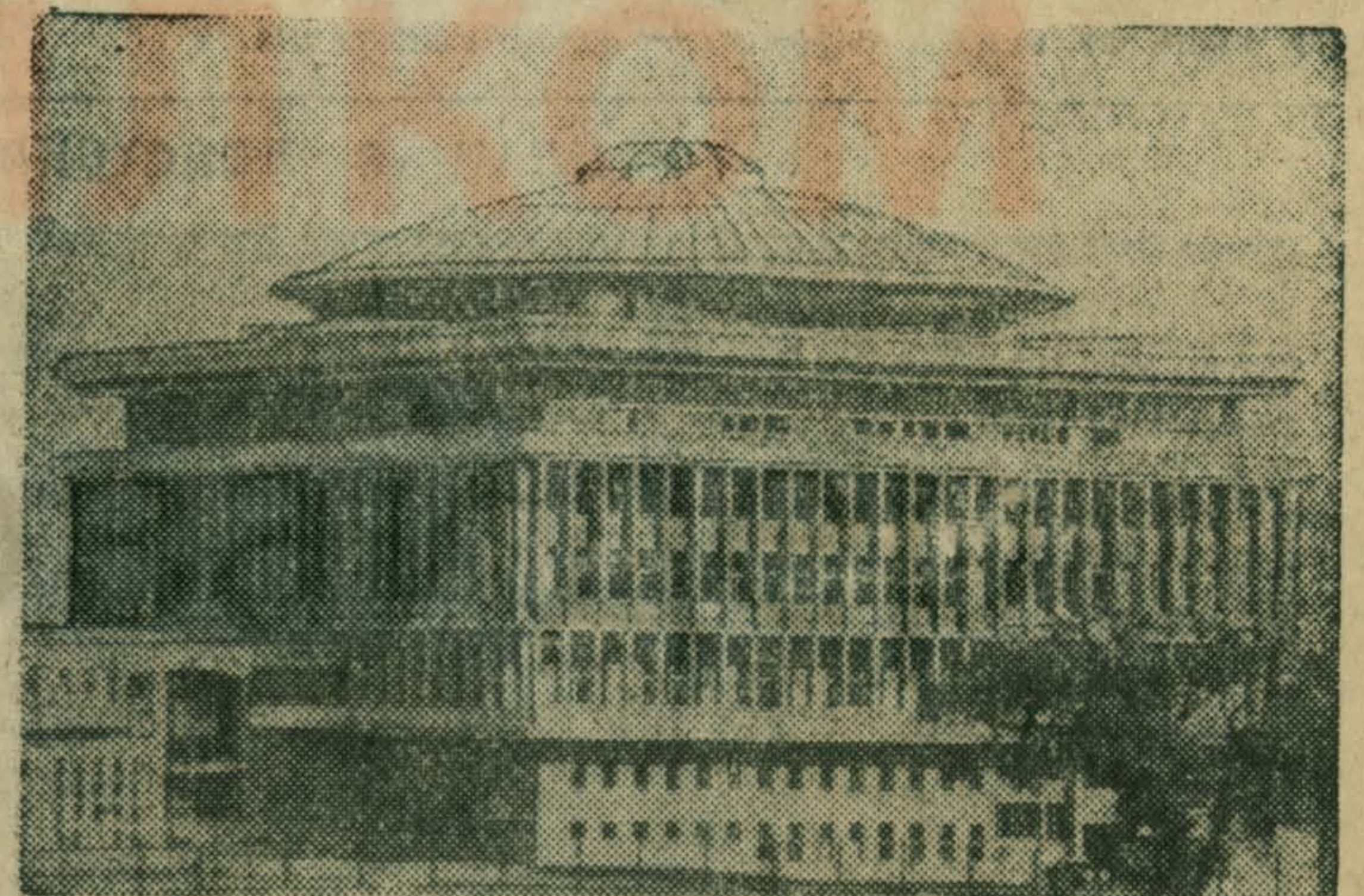
На снимке: новое здание Бухарестского политехнического института — крупнейшего высшего учебного заведения Социалистической Румынии.

СЕГОДНЯ — ДЕНЬ ОСВОБОЖДЕНИЯ РУМЫНИИ ОТ ФАШИСТСКИХ ЗАХВАТЧИКОВ (1944) НАЦИОНАЛЬНЫЙ ПРАЗДНИК РУМЫНСКОГО НАРОДА