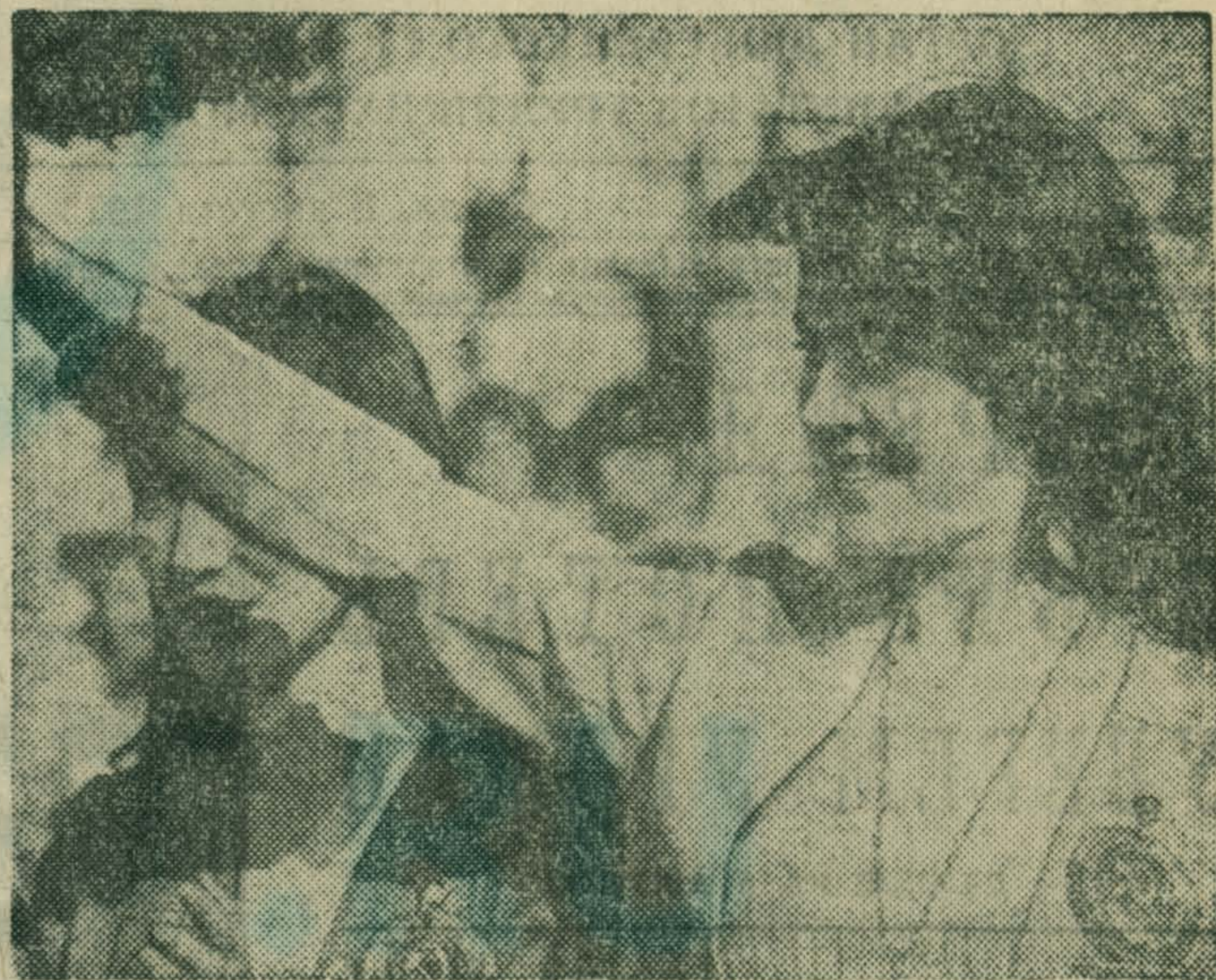
Посланцы советского комсомола на форуме юности мира.

Девять дней Берлин был столицей X Всемирного фестиваля молодежи и студентов. Девять дней за всем, что происходило здесь, с огромным интересом следили молодежь нашей планеты, прогрессивные люди земли. Над площадями, под сводами крупнейших залов города громко звучал девиз форума юных: «За антиимпериалистическую солидарность, мир и дружбу!» Молодежь гневно обличала преступления империализма и колониализма, призывала юношей и девушек земного шара укреплять антиимпериалистическую солидарность с народами, которые сражаются за национальную независимость, свободу и демократию, сплачивать свои ряды в борьбе за мир, дружбу и лучшее будущее.