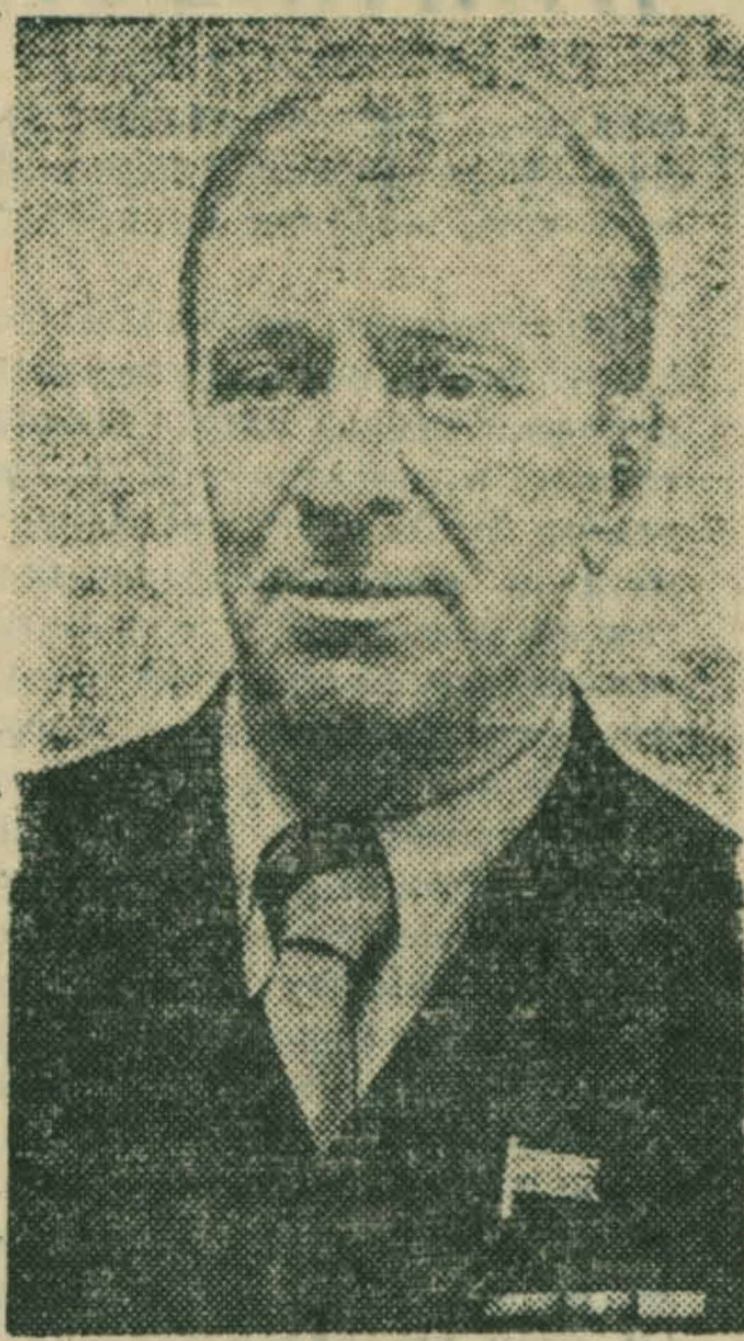
Сегодня исполняется 75 лет со дня рождения одного из первых советских поэтов-песенников Василия Ивановича Лебедева-Кумача (1898—1949).

Поэт создал несколько сот песен, завоевавших огромную популярность. Успех их определила тесная связь творчества Лебедева-Кумача с жизнью страны. Ему удалось выразить в песнях пафос героизма, патриотизм и идейную целеустремленность советских людей. Таковы «Священная война», «Песня о Родине», «Москва майская», «Марш веселых ребят», «Спортивный марш», «Веселый марш», «Веселый ветер» и многие другие.