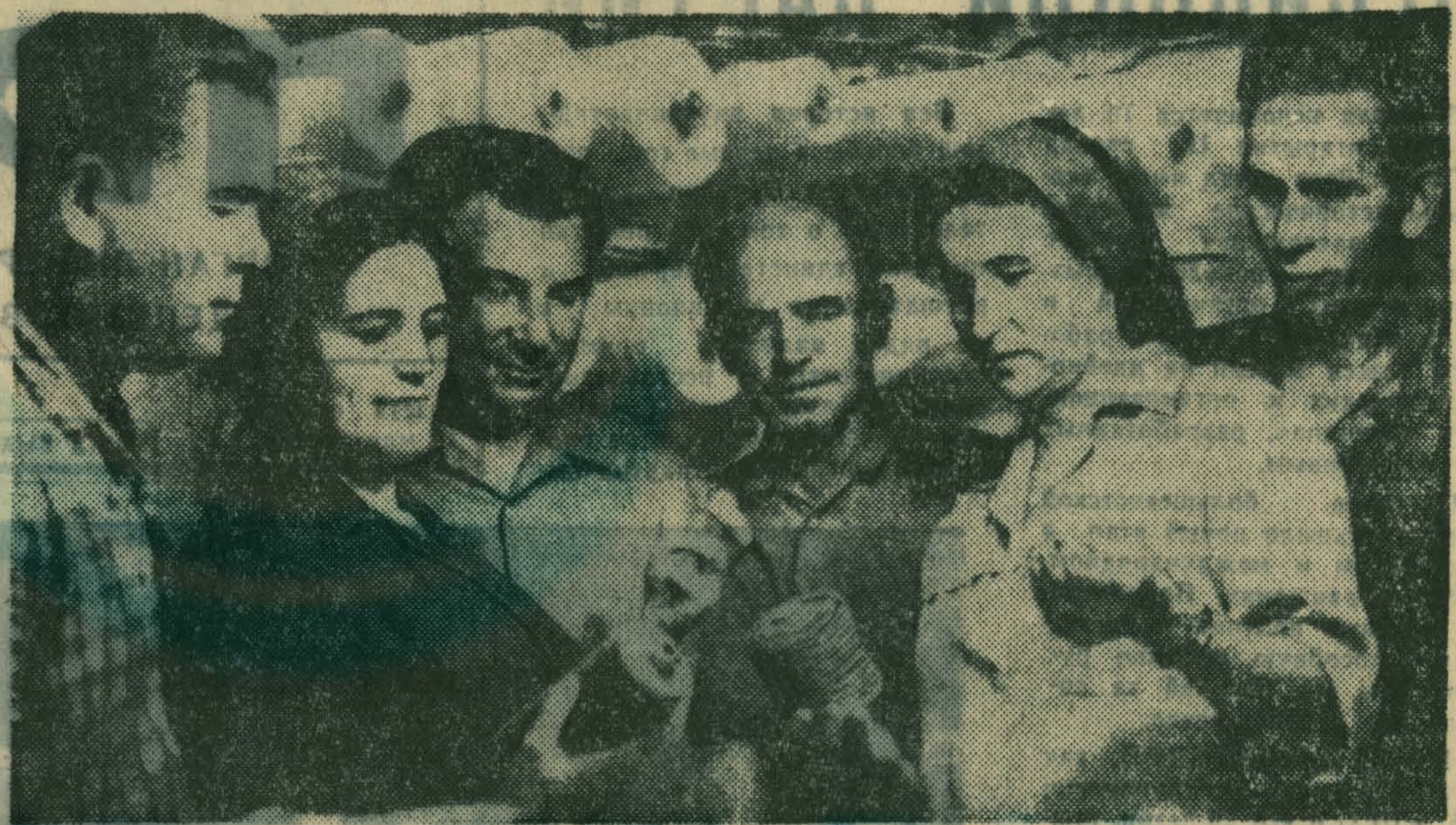
КОММУНИСТЫ В БОРЬБЕ ЗА КАЧЕСТВО

Успешному выполнению плановых заданий коллективом коврового производственного объединения способствует активная работа цеховых партгруп.