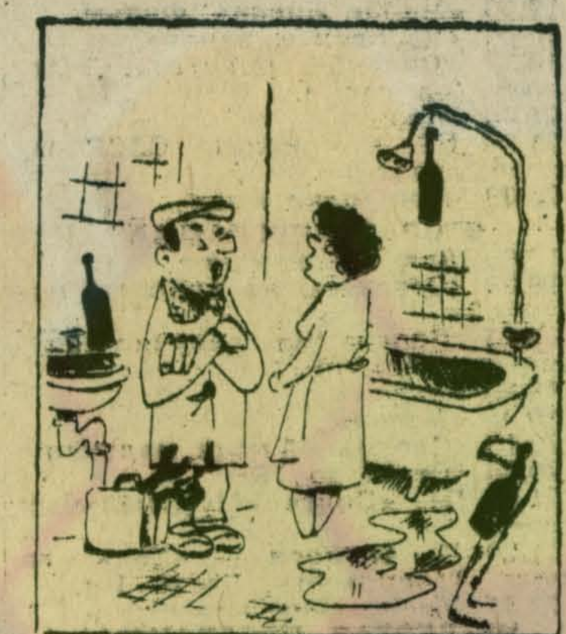
Ясно вижу все неполадки. Рис. В. Тюленева.