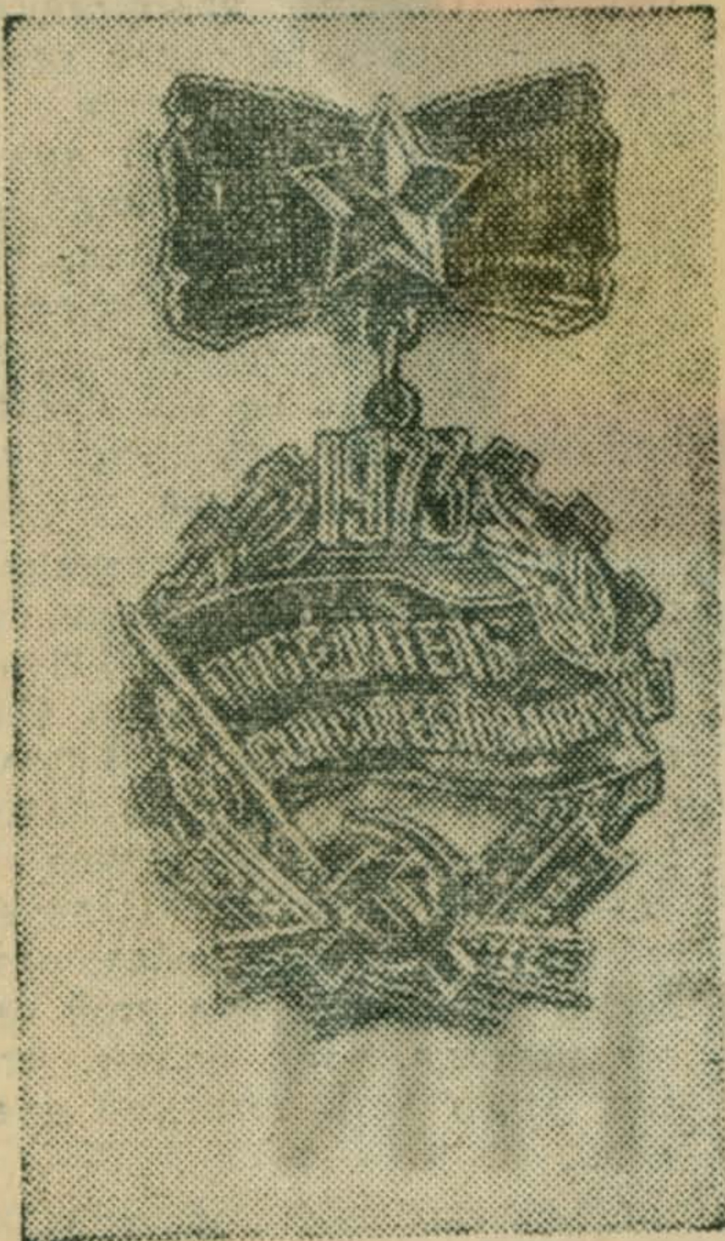
Единый общесоюзный знак «Победитель социалистического соревнования 1973 года».

Томинская птицефабрика увеличила продажу молока.