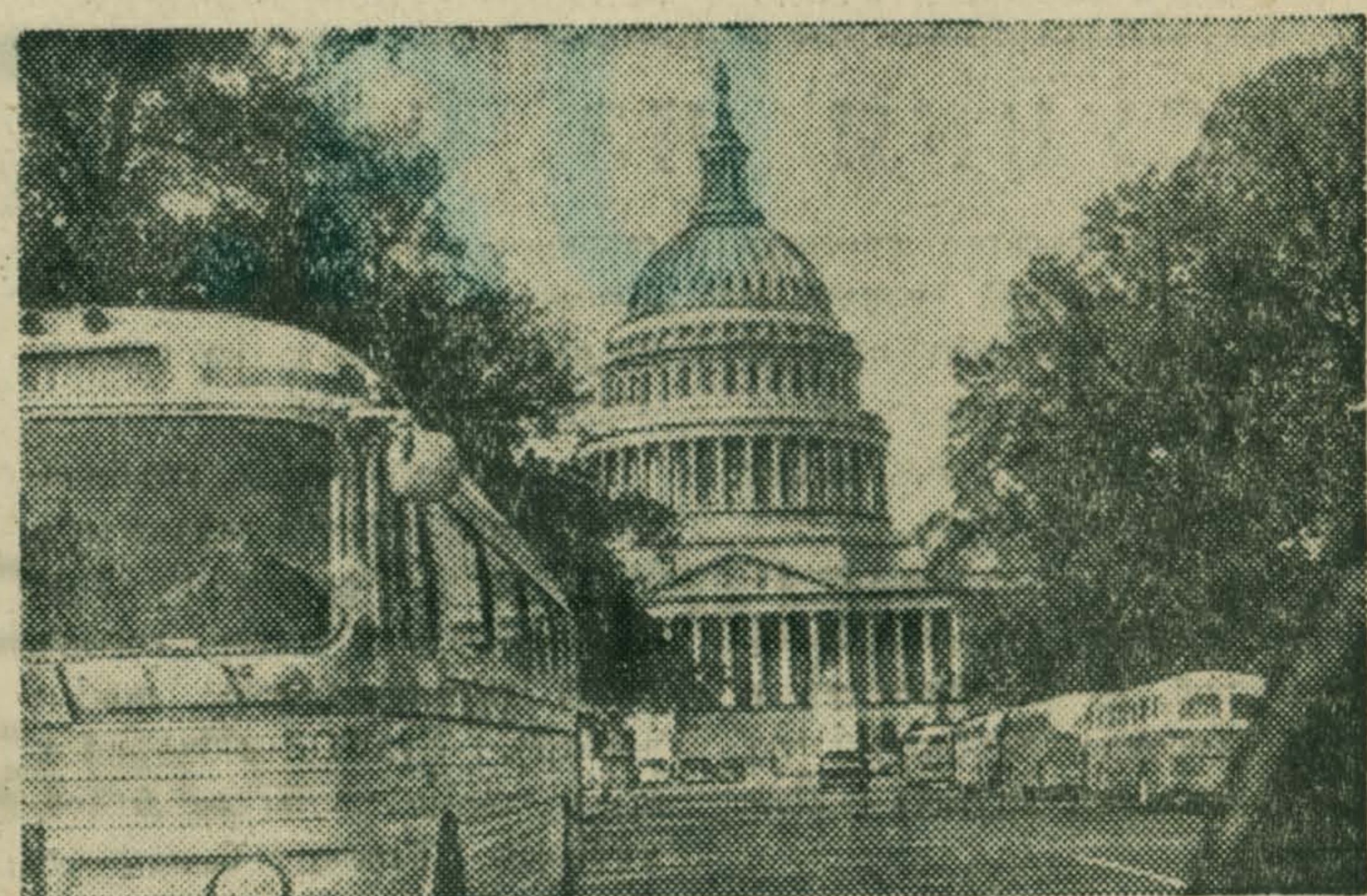
Вашингтон. В центре — здание конгресса — Капитолий.