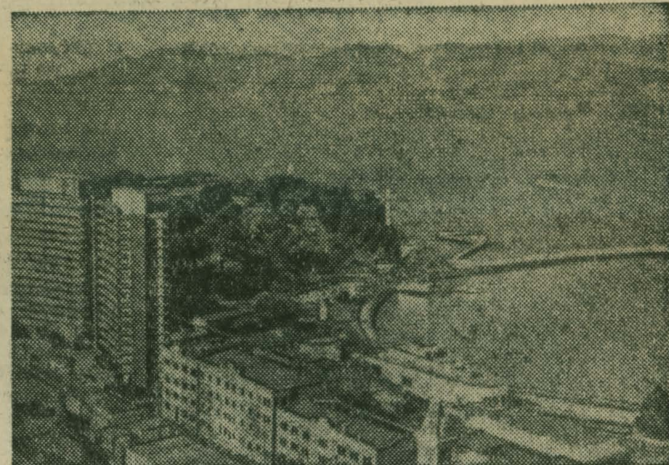
Сан-Франциско. Вид на город и бухту с высоты птичьего полета.