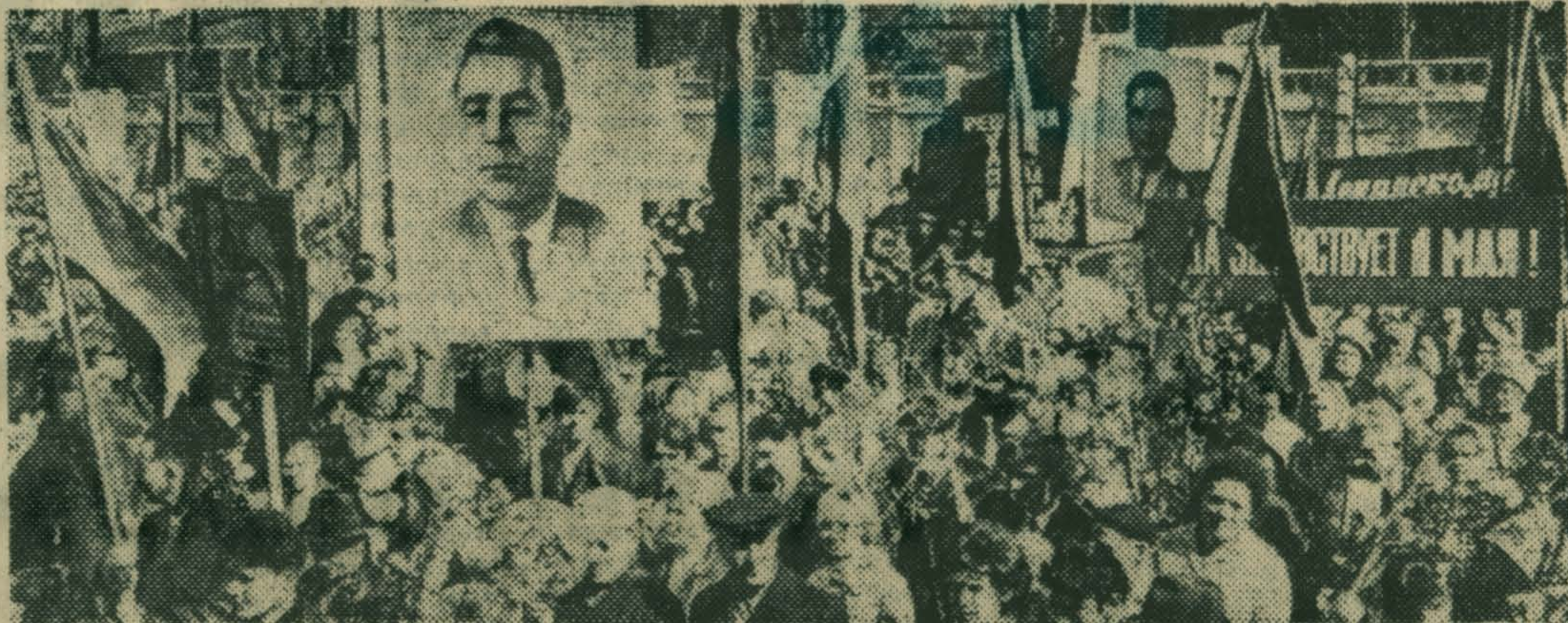
Демонстрация трудящихся в Люберцах.

Весь день не смолкали в городе, в его скверах и парке веселые песни. Праздничное гулянье продолжалось и 2 мая.