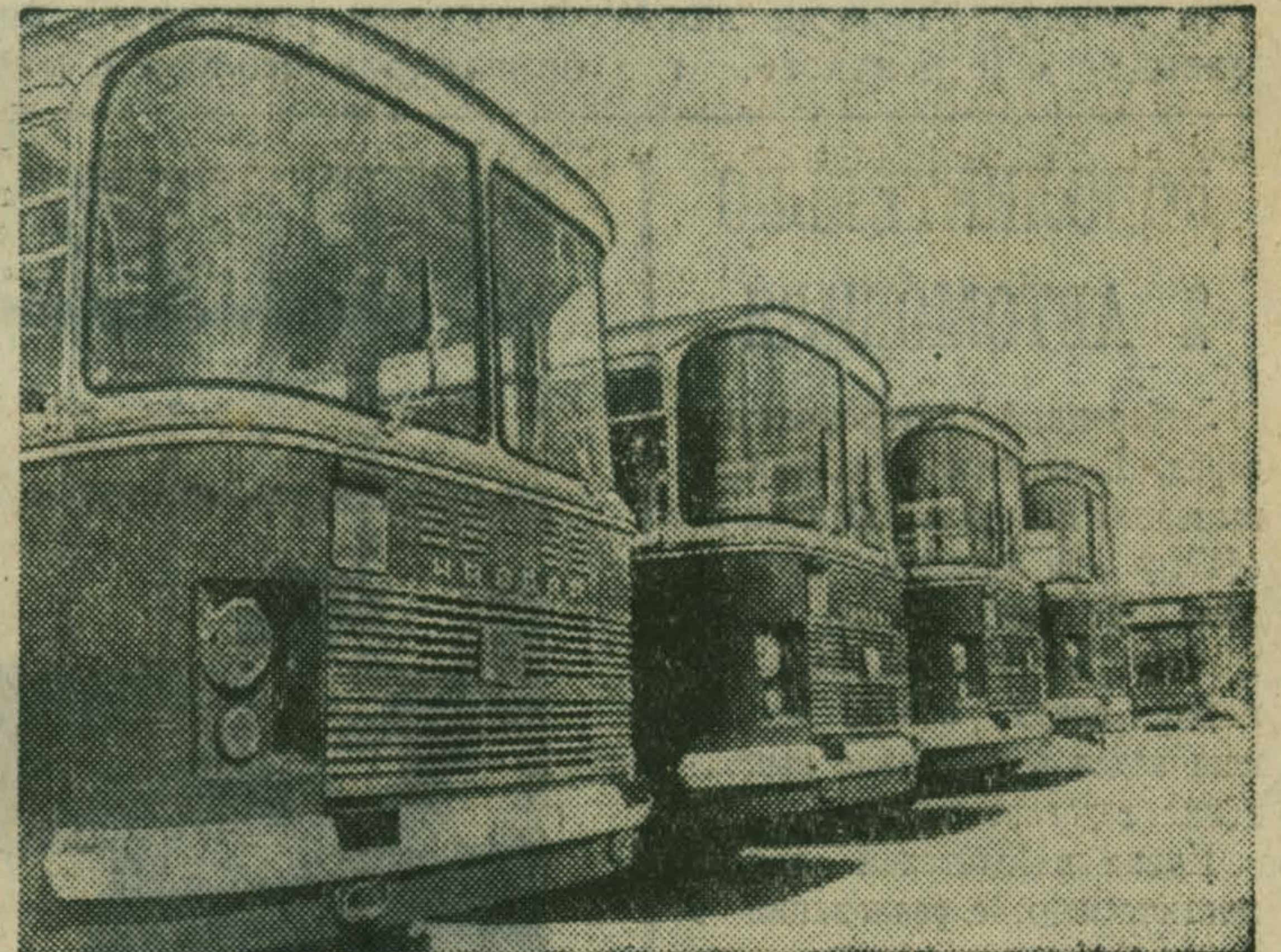
НРБ. Выпуск автомобильным заводом в городе Ботевград автобусов «Чавдар» (на снимке) — результат братского сотрудничества автомобилестроителей Болгарии и Чехословакии. Эти комфортабельные машины хорошо себя зарекомендовали во многих странах.