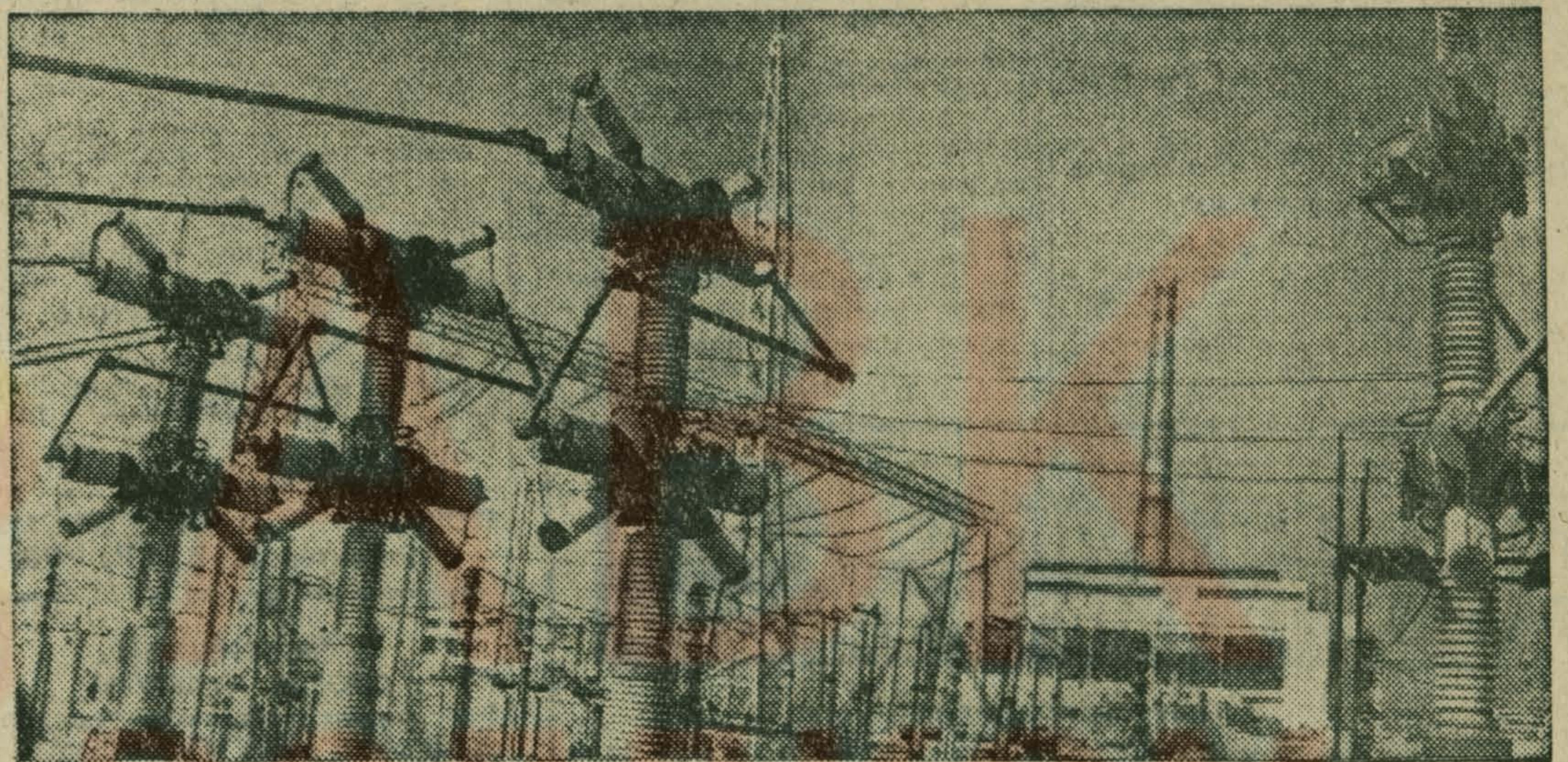
СТРОИТСЯ САМАЯ КРУПНАЯ ЭЛЕКТРОСТАНЦИЯ СТРАНЫ

В Узбекистане сооружается Сырдарьинская ГРЭС. Мощность крупнейшей в Советском Союзе тепловой электростанции составит 4400 тысяч киловатт. Завершено строительство первой очереди открытой электростанции.