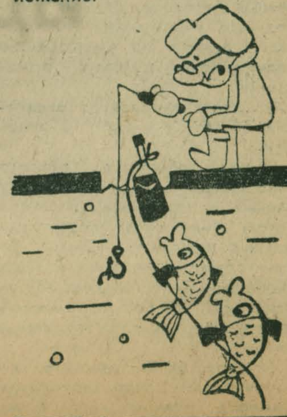
Кто первый клюнет? Рис. В. Тюленева.