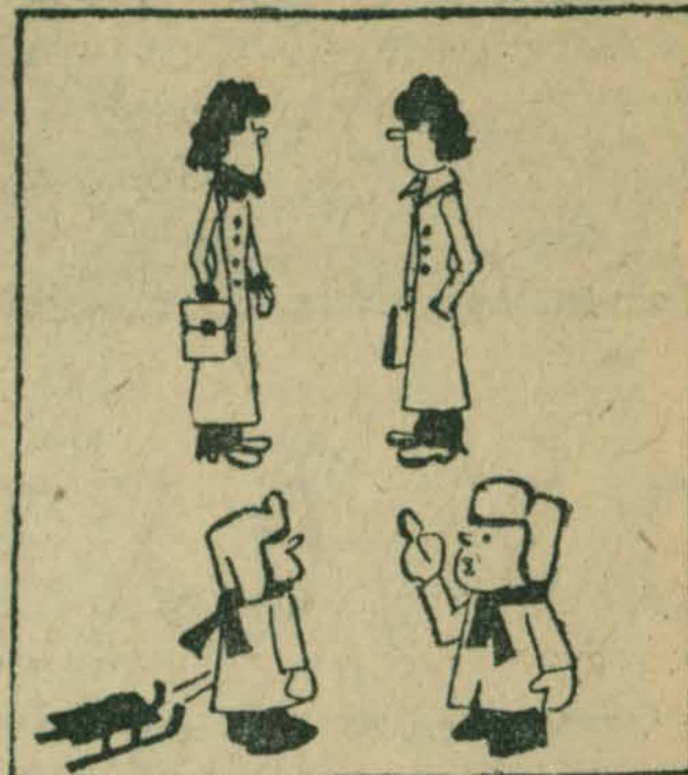
Кажется, слева моя мама, а справа твой папа.