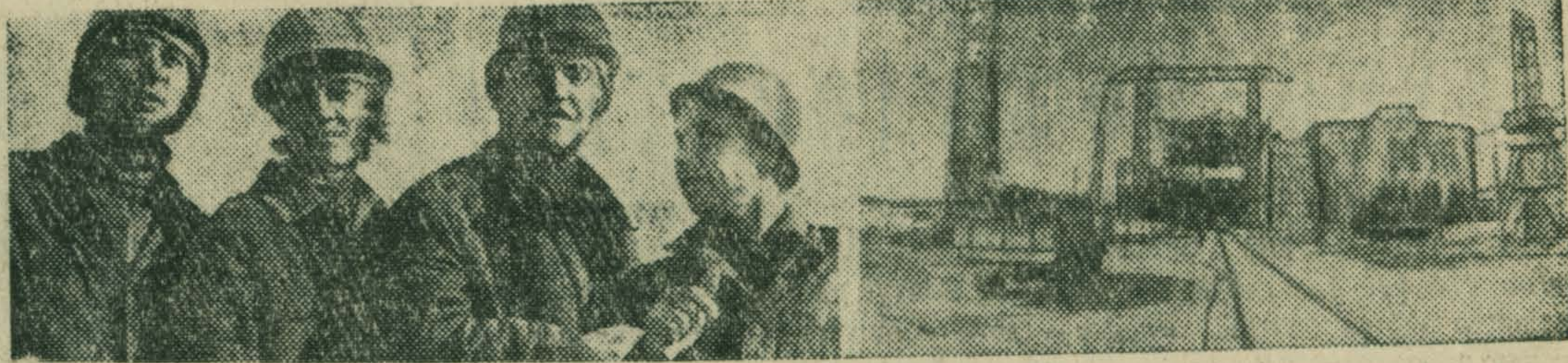
«Вести в действие первые агрегаты на Марьинской ГРЭС». (Из Директив XXIV съезда КПСС).