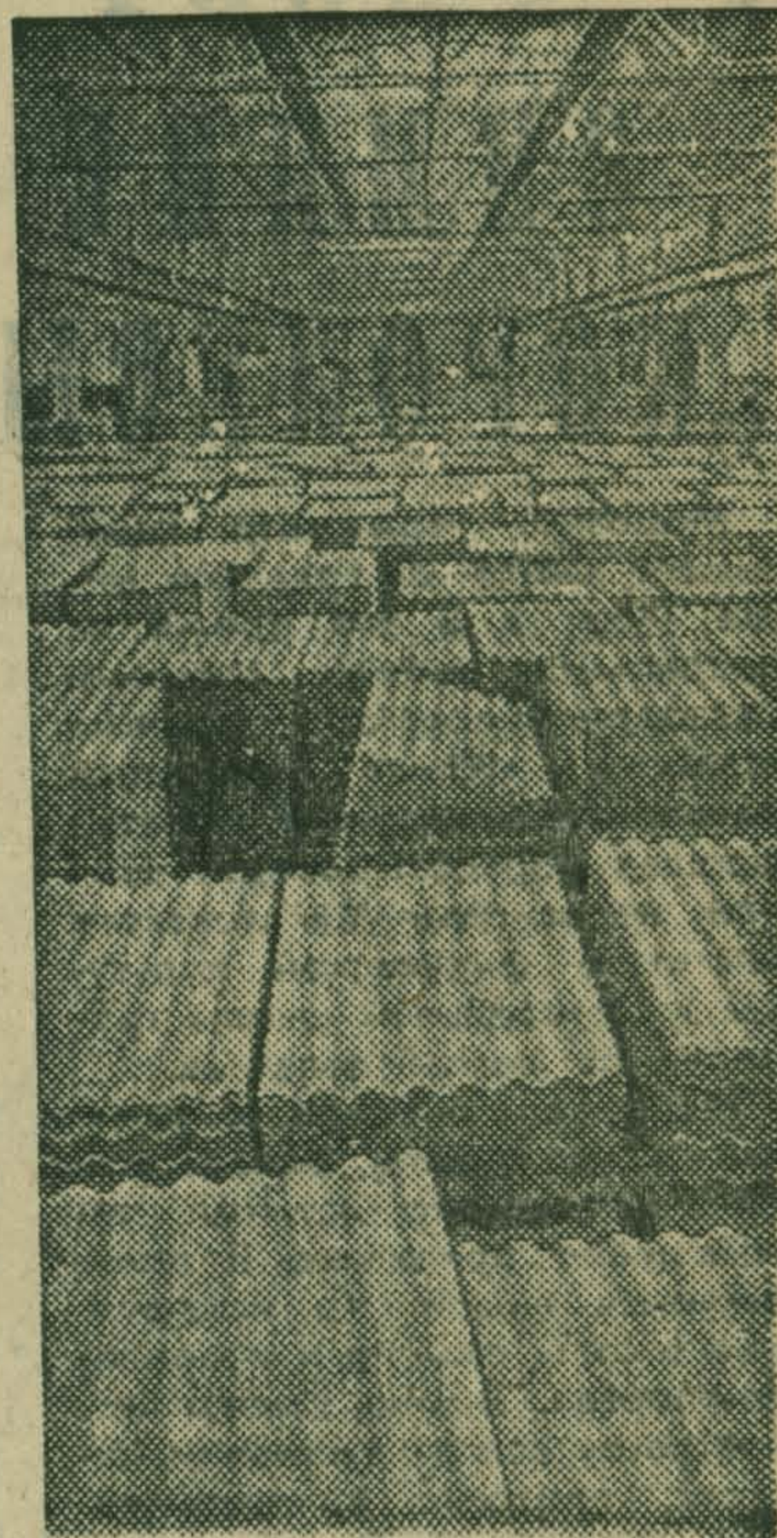
Савинский завод асбестоцементных изделий — молодое предприятие Архангельской области. Недавно здесь введена в действие вторая очередь производства листового шифера мощностью сто миллионов плит в год.

НА СНИМКЕ: на силладе готовой продукции.