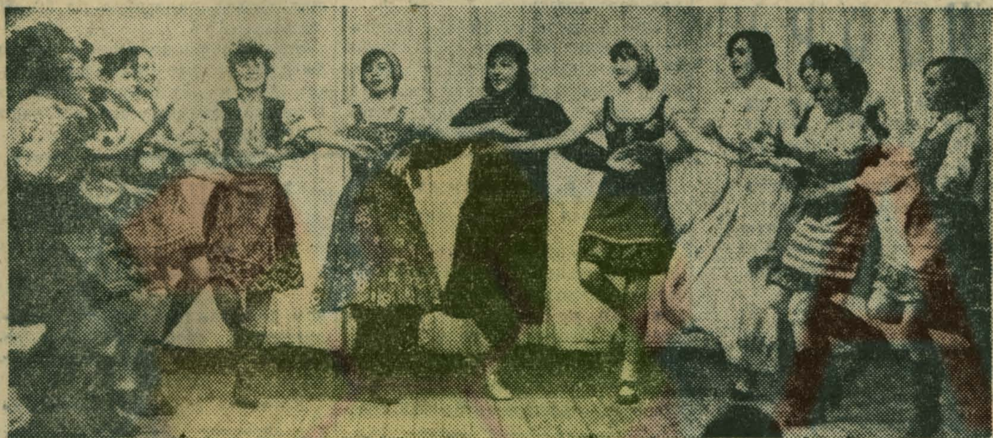
Весело прошел предновогодний концерт художественной самодеятельности Люберецкого коврового комбината.

Следующий номер «Люберецкой правды» выйдет 3 января 1973 года.