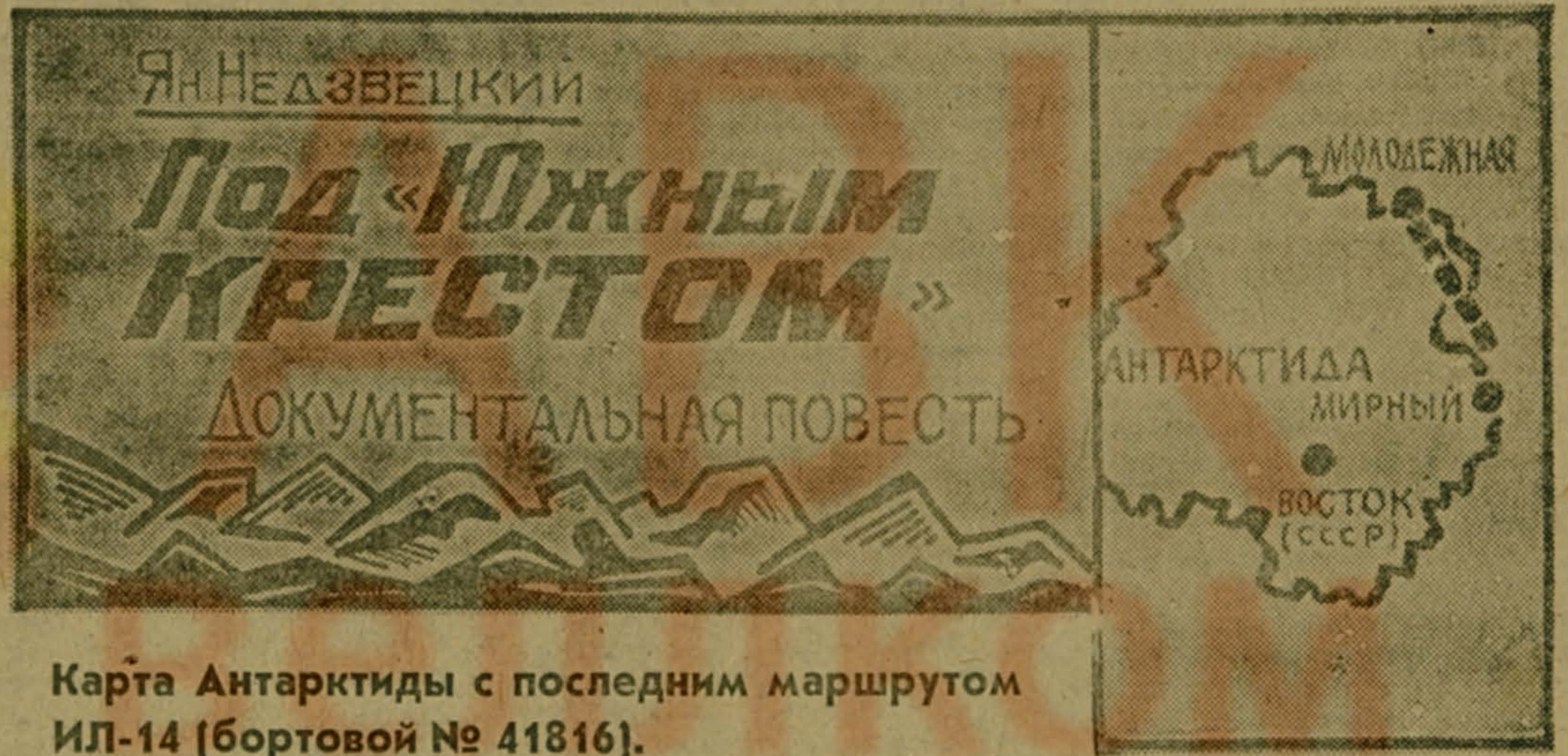
Карта Антарктиды с последним маршрутом ИЛ-14 (бортовой № 41816).

В. ШИСЛЕР, заведующий отделом писем «Люберецкой правды».