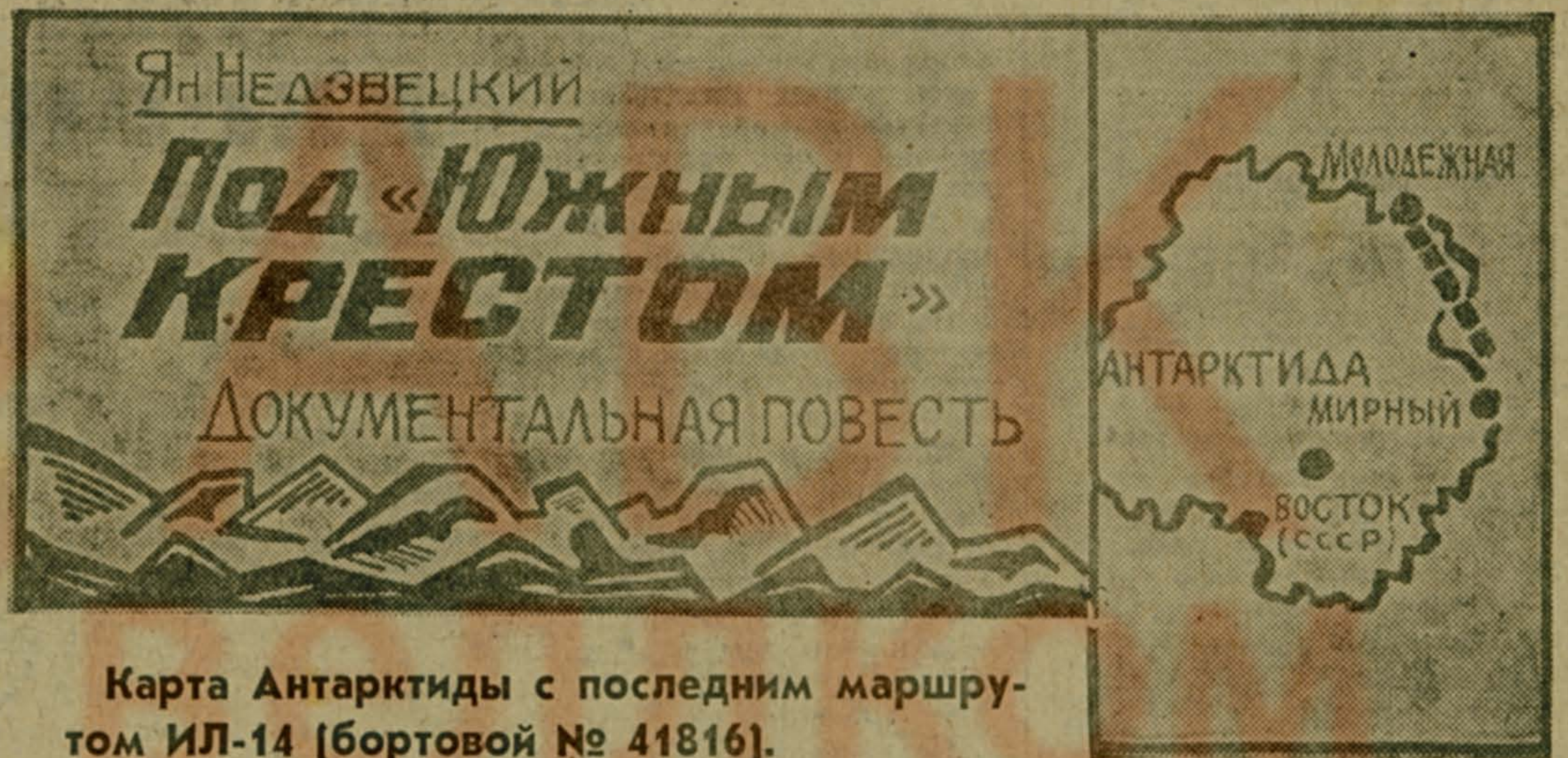
Карта Антарктиды с последним маршрутом ИЛ-14 (бортовой № 41816).