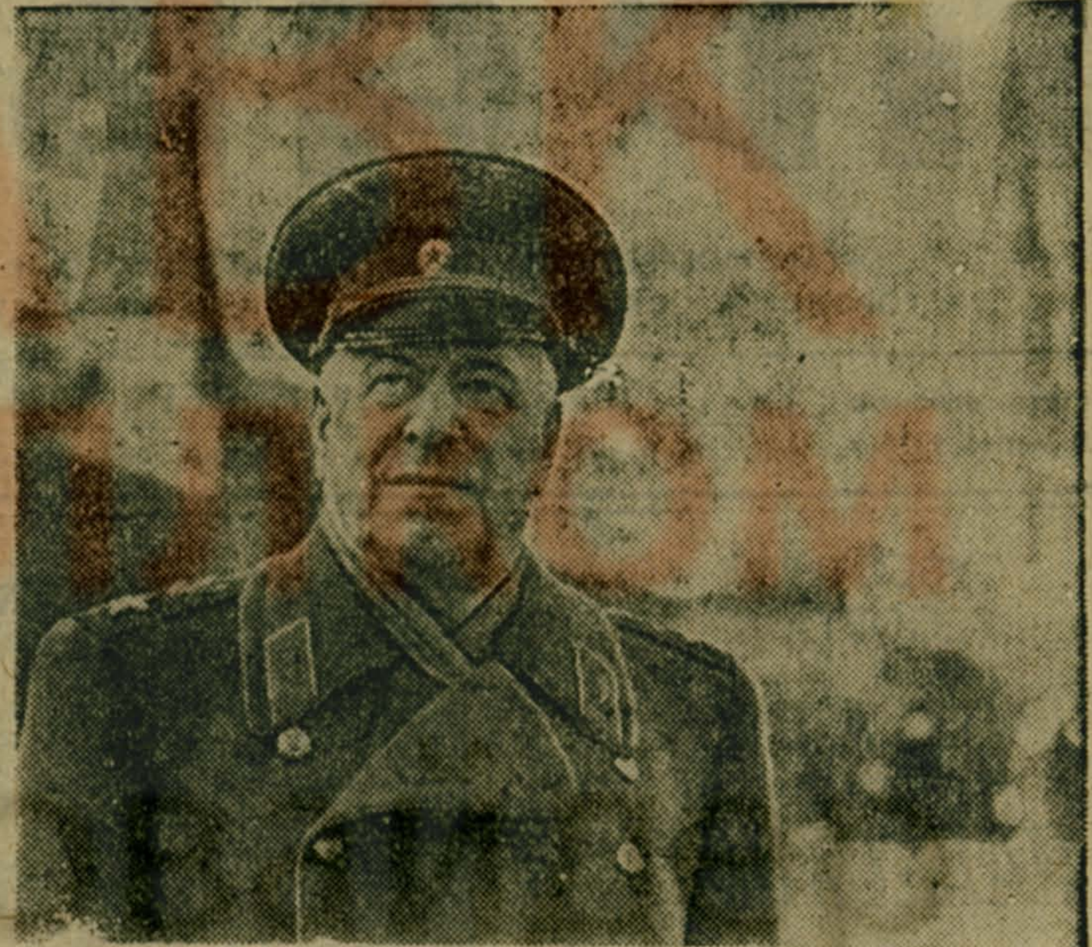
На снимке: Маршал Советского Союза, четырежды Герой Советского Союза Георгий Константинович Жуков.

1 декабря — 90 лет со дня рождения Г. К. Жукова (1896—1974)