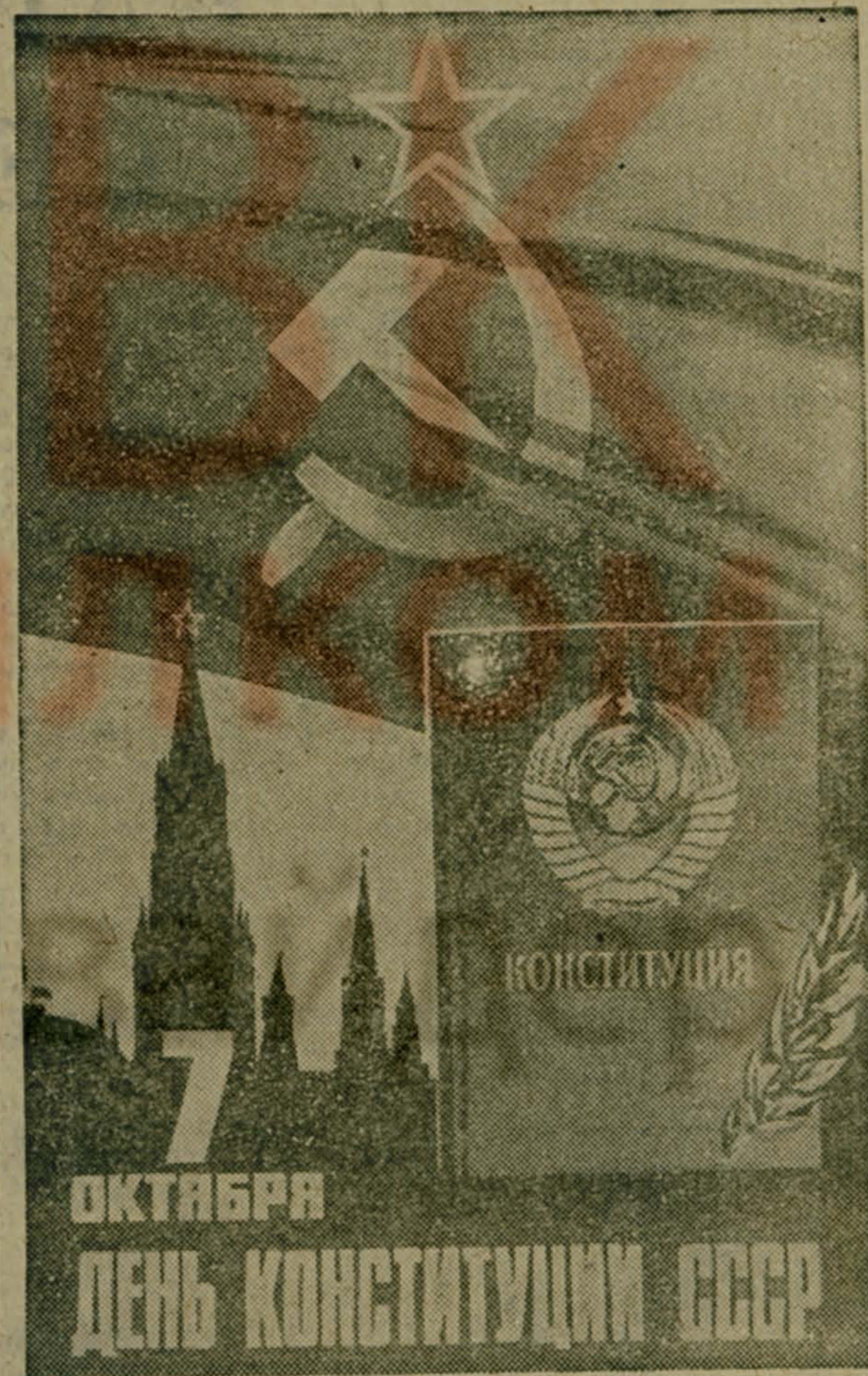
Плакат художника В. Викторова. Издательство «Плакат».