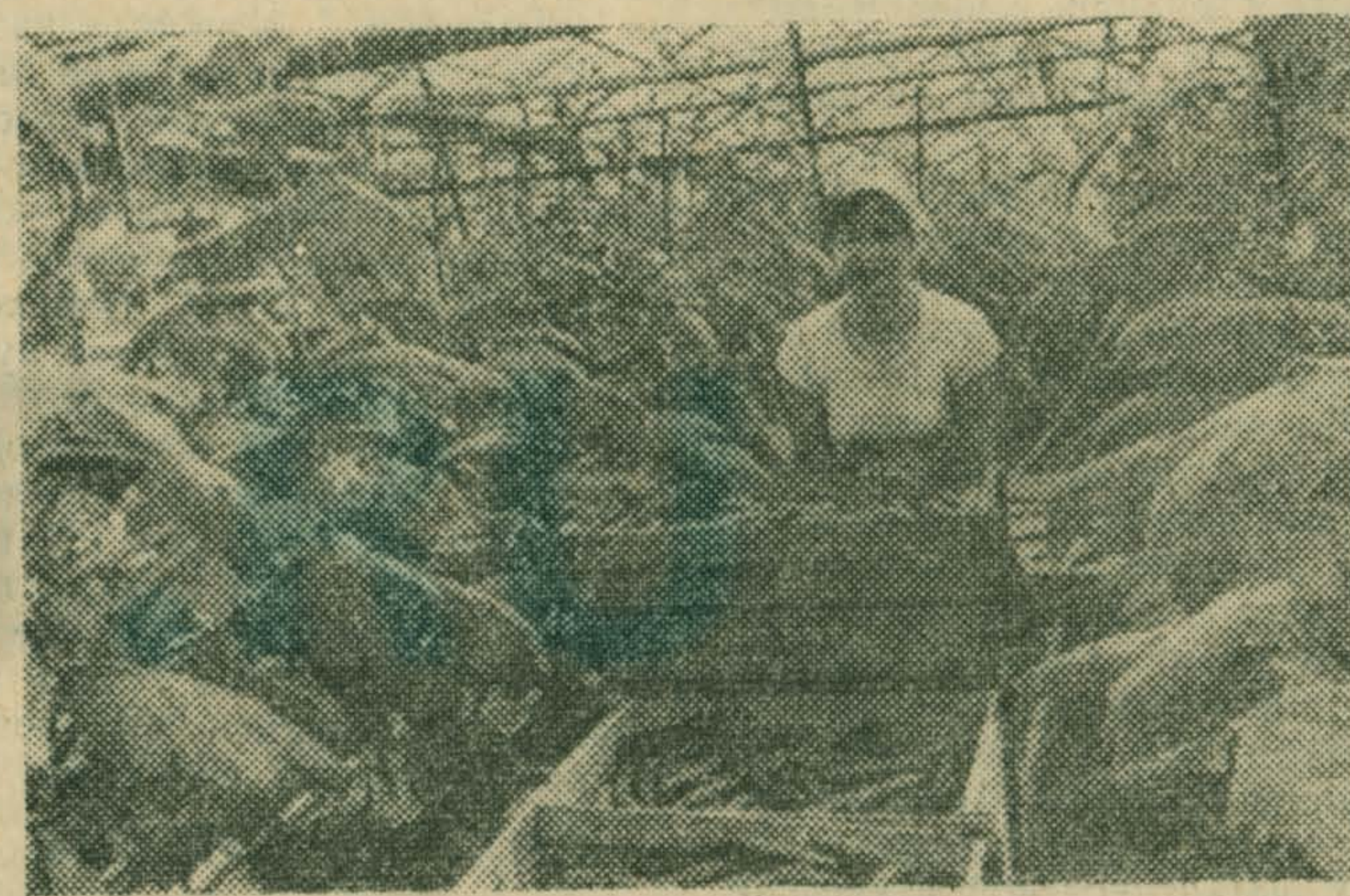
Профессионально-техническое училище, расположенное на территории совхоза «Марфино», имеет свою учебно-производственную базу. Здесь учащиеся получают навыки работы в теплицах, у квалифицированных растениеводов перенимают опыт получения высоких урожаев различных овощей.

АДРЕС УЧИЛИЩА: 127427, Москва, Кашеннин луг, дом № 4, телефоны 218-16-77, 218-40-95.