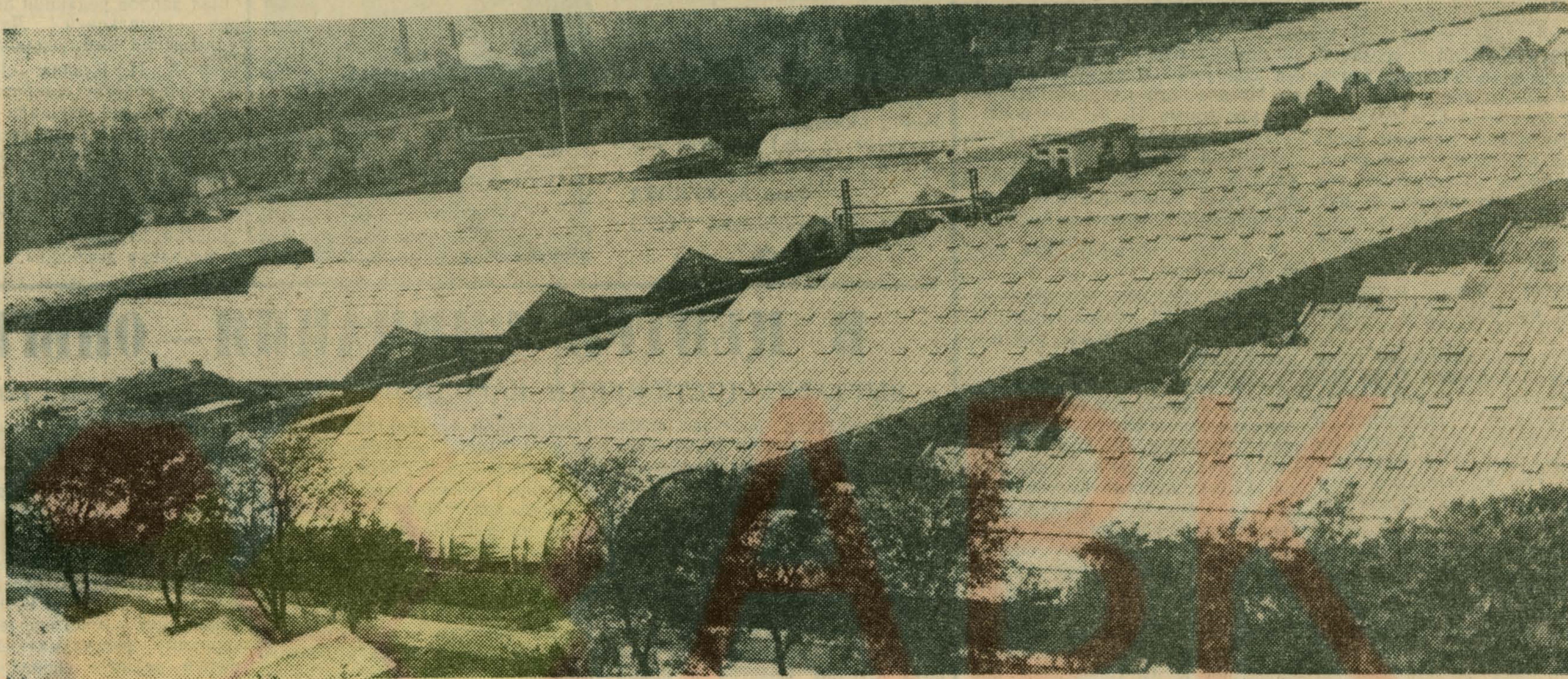
ТЕПЛИЧНЫЙ КОМБИНАТ ПРОФЕССИОНАЛЬНО-ТЕХНИЧЕСКОГО УЧИЛИЩА № 165.