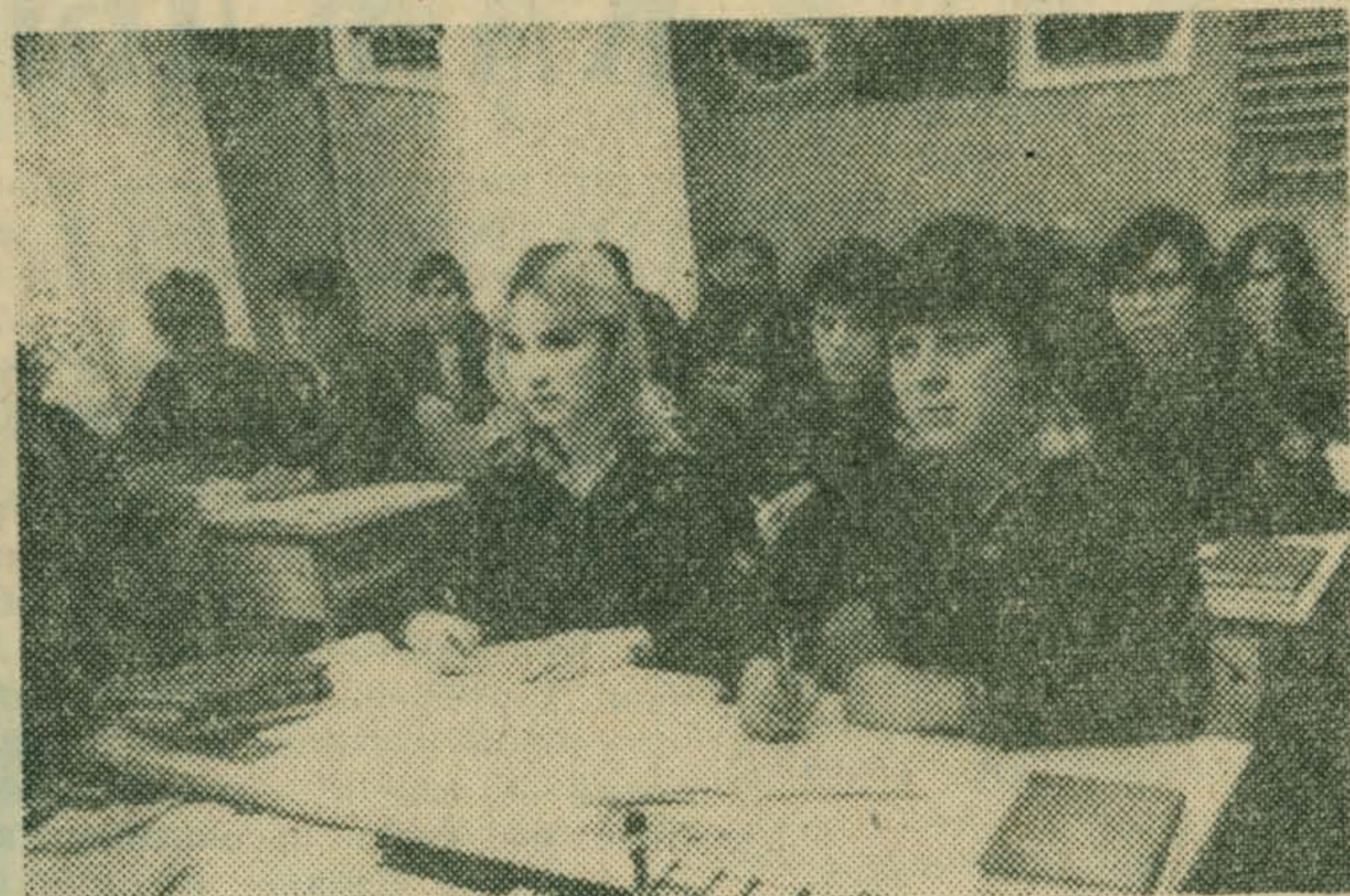
Программный материал гораздо легче усваивается учащимися в кабинетах, оборудованных с учетом требований научной организации труда.