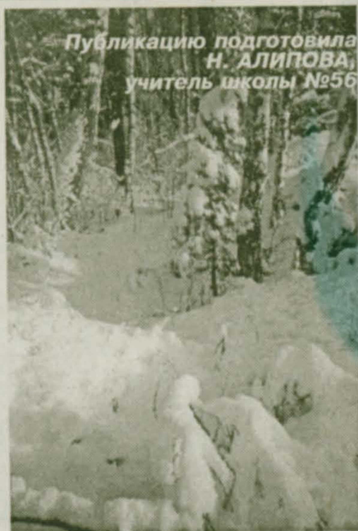
Публикацию подготовила Н. АЛИПОВА, учитель школы №56