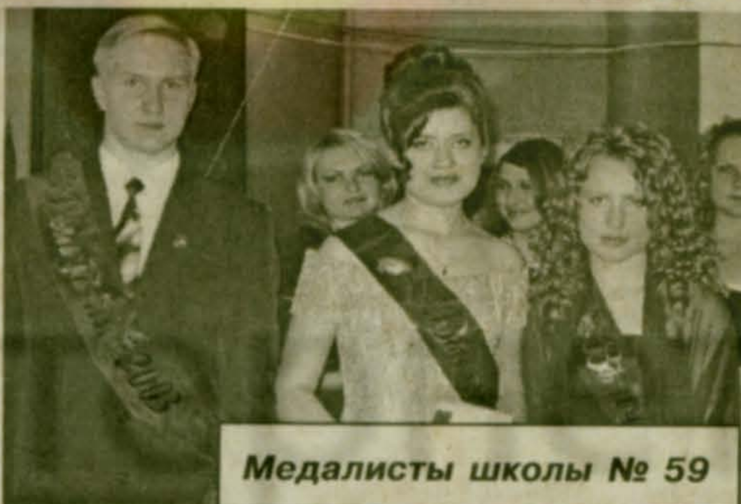
Медалисты школы № 59