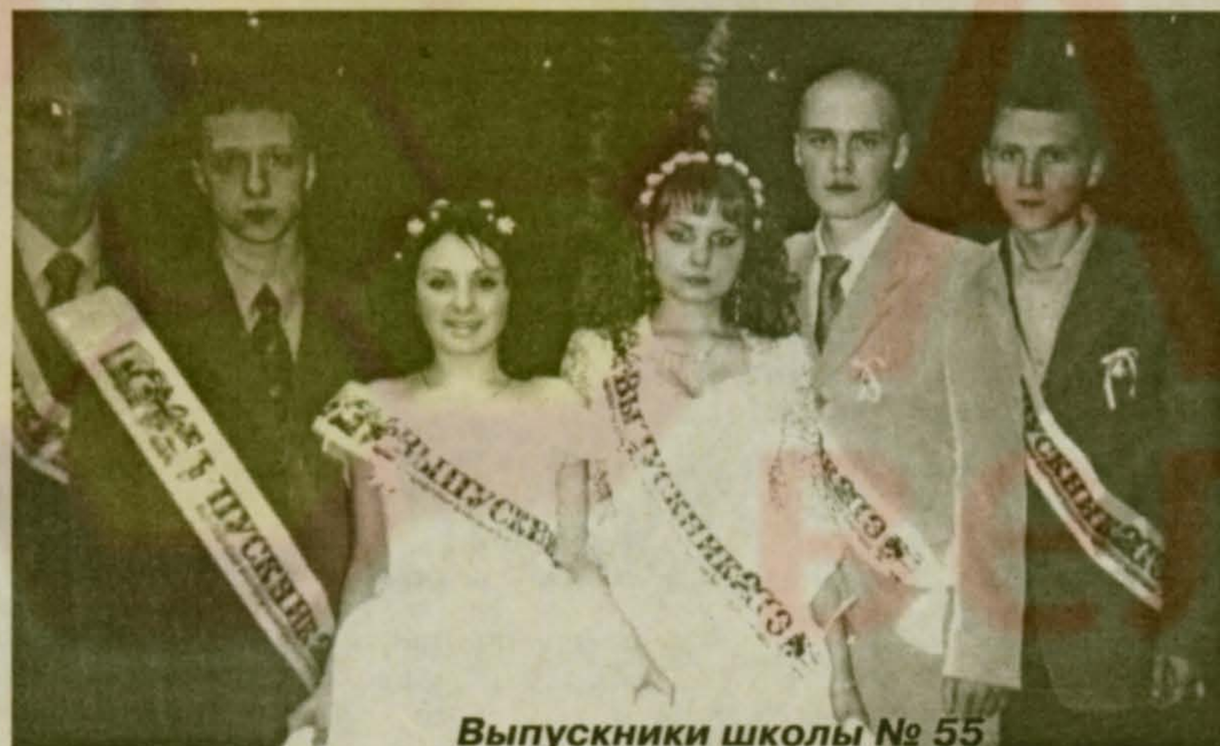
Выпускники школы № 55

как бы ни уносило время, в самые счастливые минуты вы войдете в новую жизнь и донесется от вас далекий эхом: «Позвони мне, позвони...»