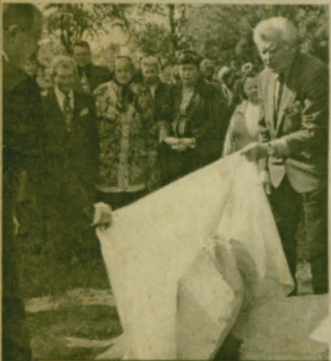
Снимается покрывало с памятного камня