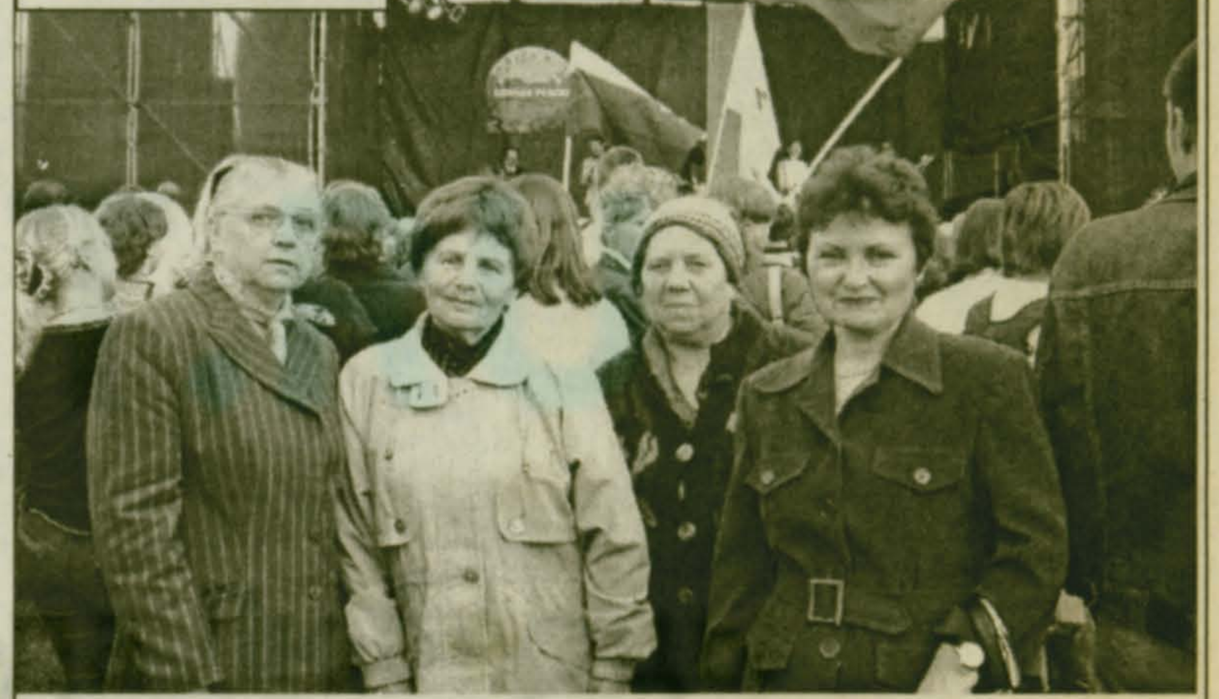
Красковчане в г. Балашиха