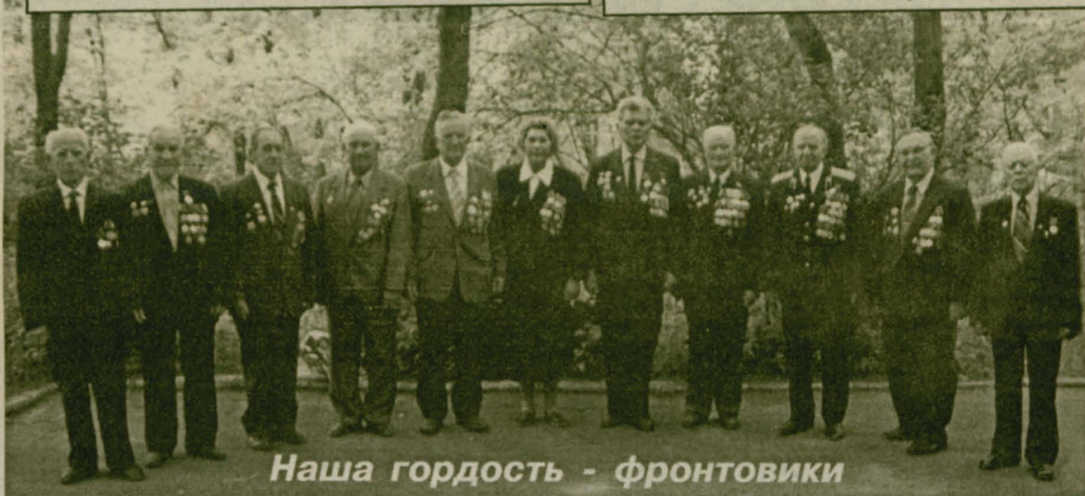
Наша гордость - фронтовики