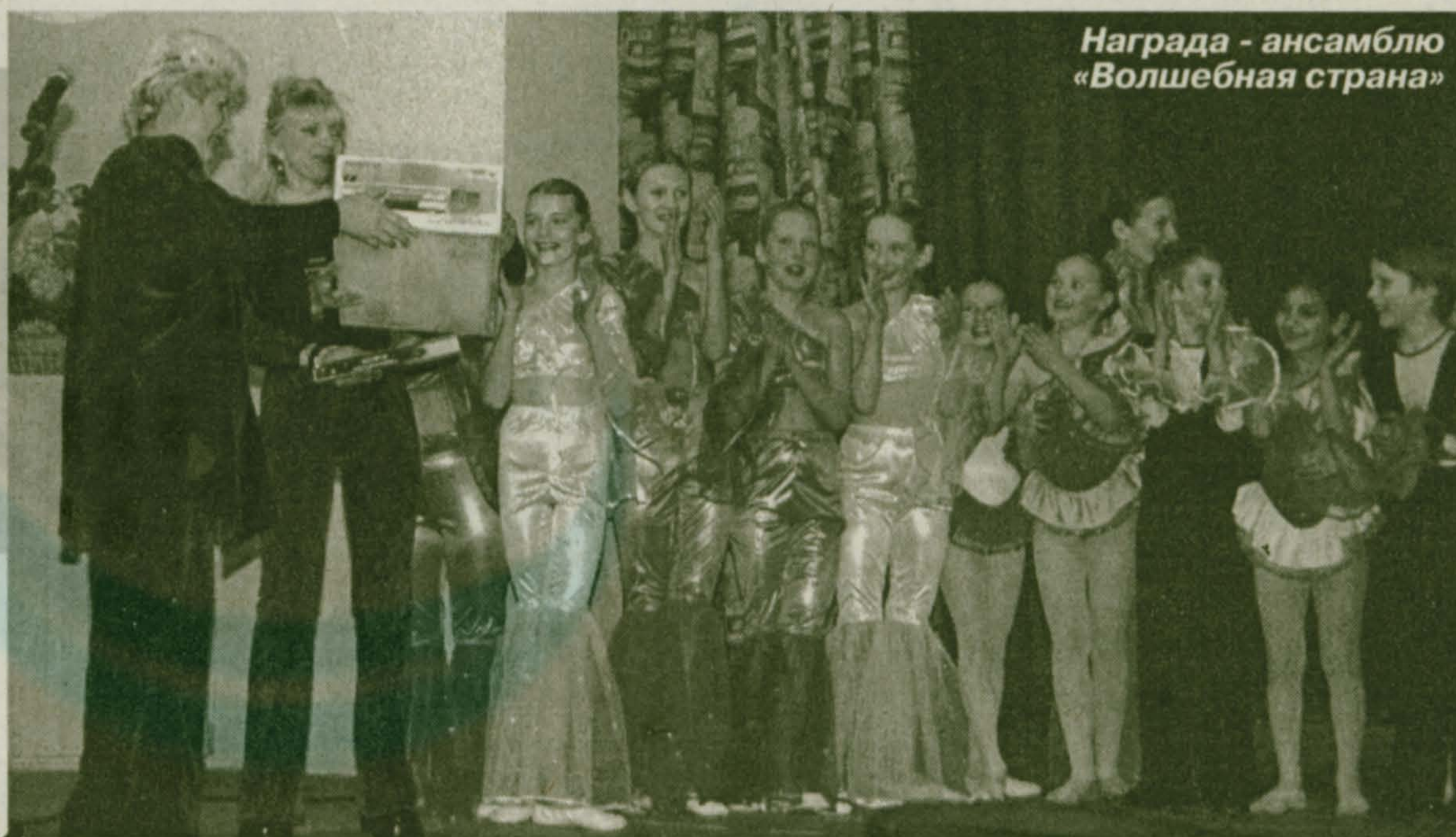
Награда - ансамблю «Волшебная страна»