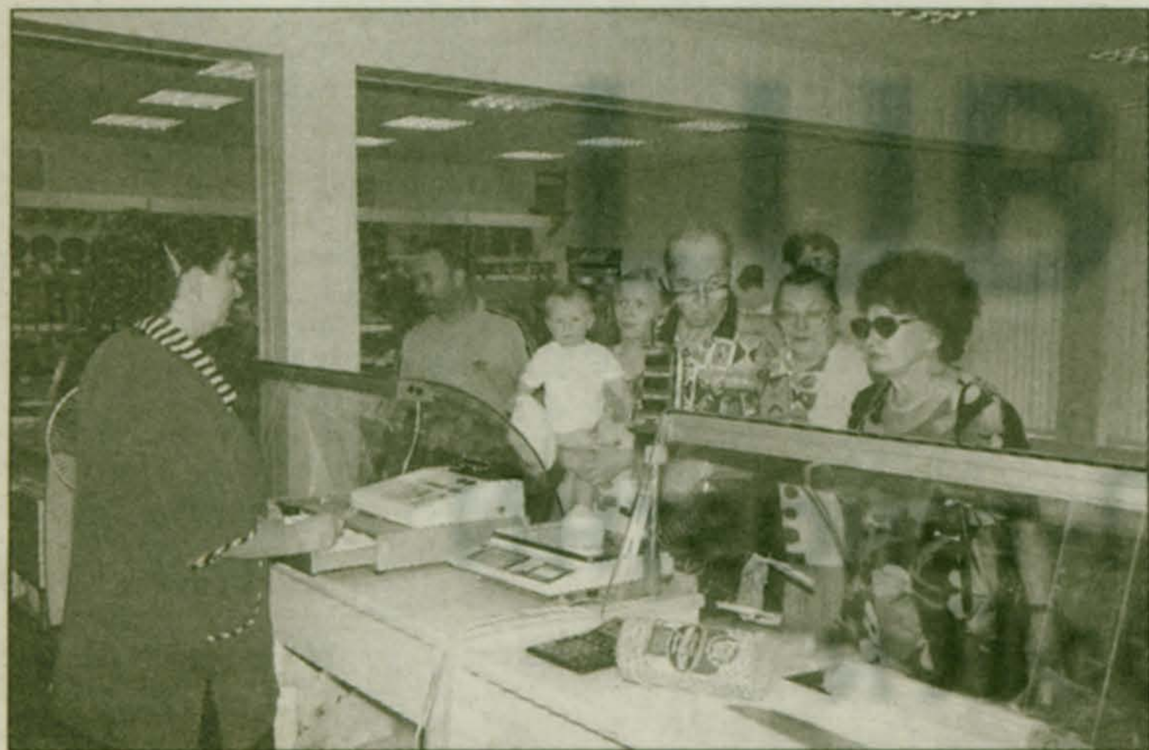
Нет человека, который бы ни пользовался услугами торговли и сервиса. И как ни крутите, но профессиональный праздник многочисленных работников прилавка - это и наш с вами праздник.

Помните, как в былые времена, краснощекая продавщица за прилавком, дурея от длиннющей очереди, в которой мы терпеливо выстаивали за колбасой, мясом, сыром и сгущенкой, недовольно бросала в нашу сторону: "Вас много, а я - одна". И этим было сказано всё, что представляла наша советская торговля: она сама по себе, а мы - сами по себе. Чего уж было ожидать единения, взаимности, большой любви и многого другого, что мы видели в идеале, но не у нас.