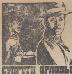
«Менее чем за два часа экранного времени мы должны были передать сложную и поучительную, трагическую и в то же время полную глубокого социального оптимизма историю супругов Орловых. Неудачно попытка показать людей, привыкших ко асемму, ослепших к маршности своего быта, и объяснить, что это хорошие, но несчастные люди, и не они виноваты в том, что они таковы, а существовавший тогда социальный строй — так сказал об этом фильме его режиссер Марк Донской.

Многие творческие робиды этого старшего советского режиссера связаны с произведениями Максима Горького: «Детство Горького», «В людях», «Мои университеты», «Мать», «Фильм Горького». На является исключением и фильм «Супруги Орловы», созданный по мотивам ранних рассказов М. Горького.