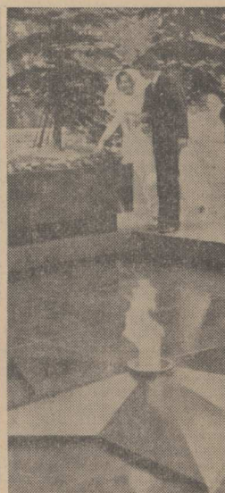
Трещет пламя вечного огня. Тем пламенем сердца людей согреты. Ты сбереги навек минуку эту, Волнение Торжественного дня.