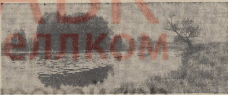
ПРОЩАНИЕ С ЛЕТОМ.