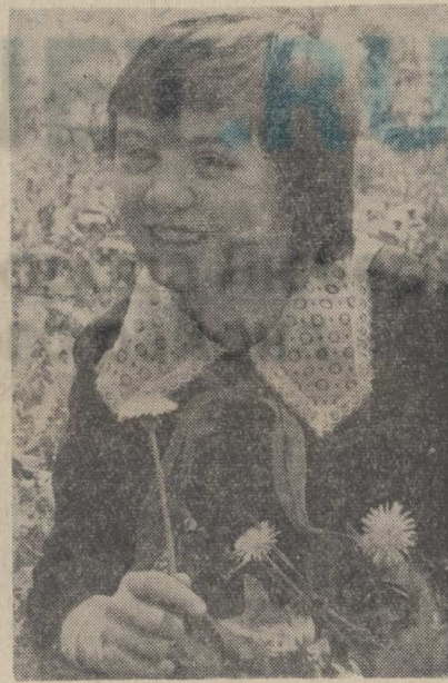
ЛЕТО ПРЕКРАСНОЕ...