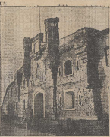
Брест. Подвигу, совершенному защитниками города-героя, посвящен мемориальный комплекс «Брестская крепость-герой». НА СНИМКЕ: Холмские ворота Брестской крепости.

История не знала подобных примеров такого массового героизма, самопожертвования во имя защиты своей Родины, величия духа и сокрушительного отпора агрессору, которые проявил советский народ в годы Великой Отечественной войны.