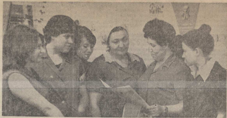
СТРОЙКАМ — КАЧЕСТВО И РИТМ

зам. председателя штаба военно-патриотического воспитания молодежи при Люберецком ГК ВЛКСМ.