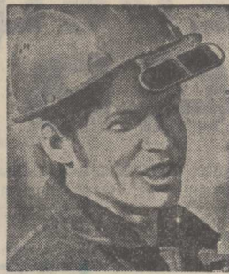
Кемеровская область. Уважением и авторитетом пользуются в коллективе Кузнецкого металлургического комбината молодой сталевар электросталеплавильного