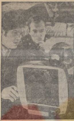
ХОТЯ ПИСЬМО И НЕ НАПЕЧАТАНО